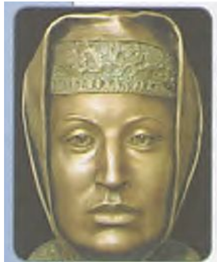
Софья Палеолог. Реконструкция С. А. Никитина