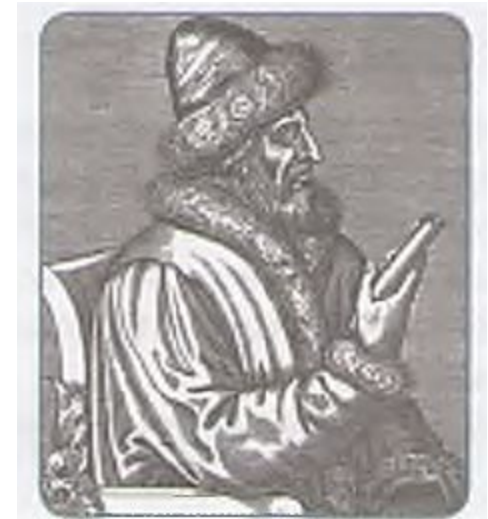
Василий III. Гравюра XVI в.