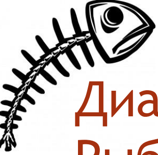
Диаграмма Исикавы Рыбий скелет 😊

Предполагается несколько этапов мозгового штурма и составления диаграммы: