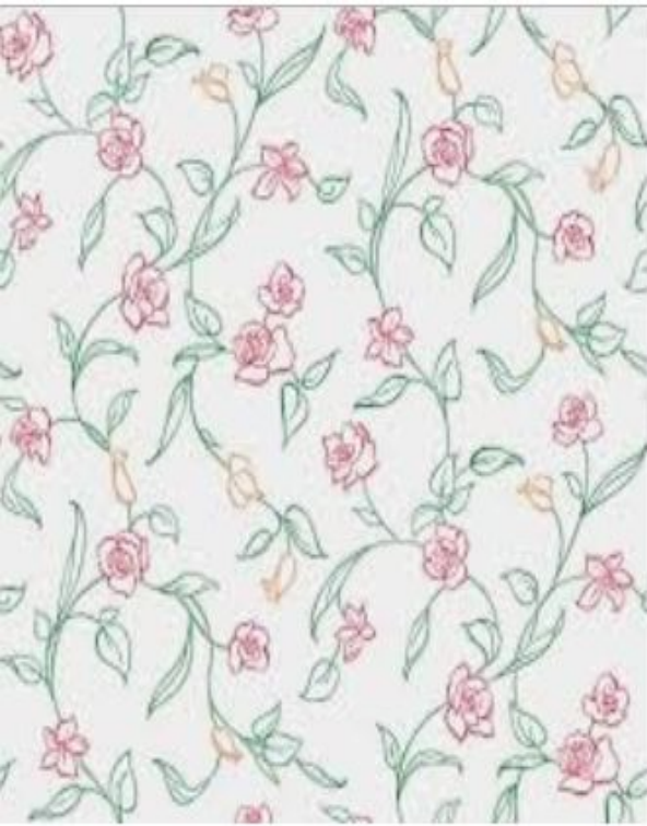
장미꽃 무늬, 작은 꽃 배경 그... kor.pngtree.com