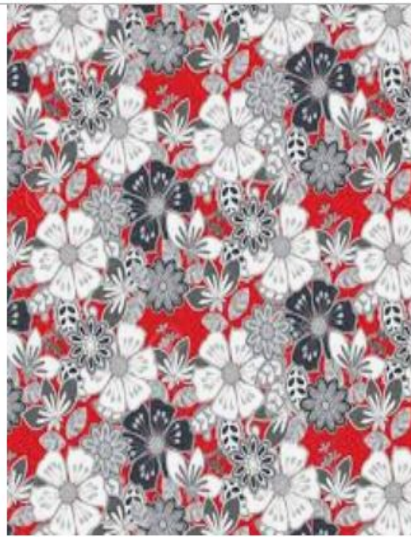
비공식적 인 패브릭 패턴에 ...