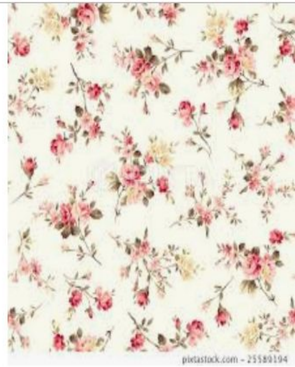
꽃, 플라워, 꽃무늬 - 스톡일... kr.pixtastock.com