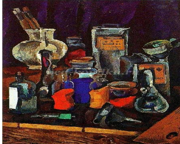
3. Петр Кончаловский. «Сухие краски»