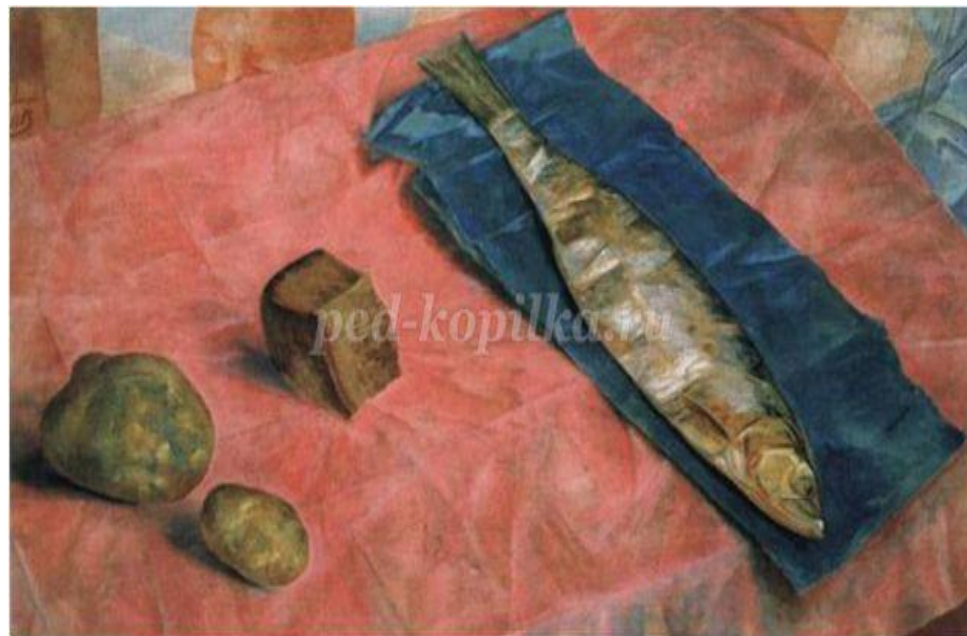
4. К. С. Петров-Водкин «Селедка»