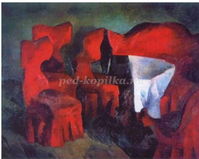
2. Роберт Фальк. «Красная мебель»