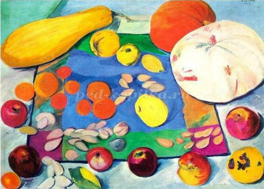
1. М.С. Сарьян. Натюрморт