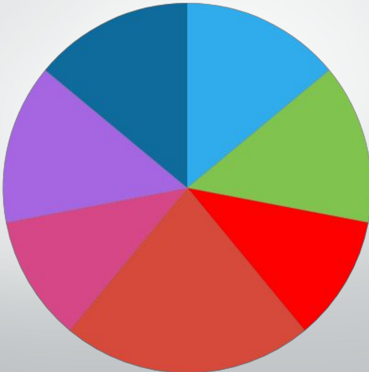
Диаграмма 2. Семейные ценности супругов, проживших более 20 лет в браке