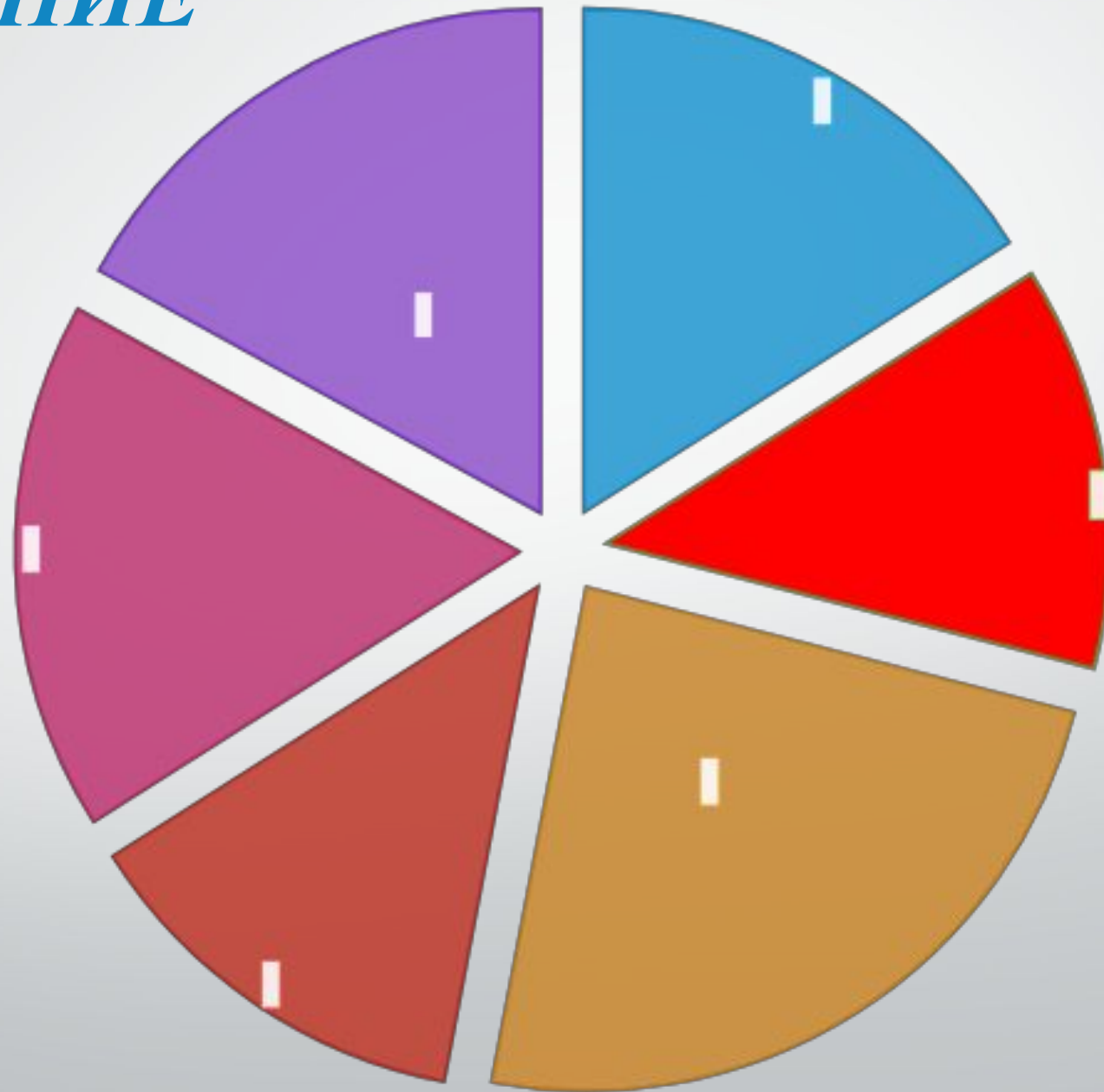
Диаграмма 1. Семейные ценности молодых супругов