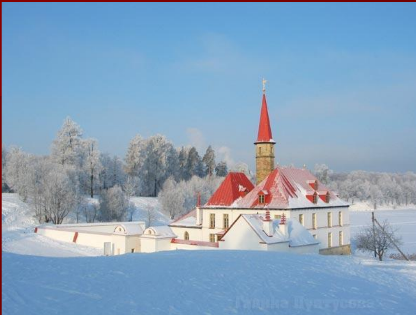
Окрестности Гатчины Приоратский дворец архитектор Николай Львов