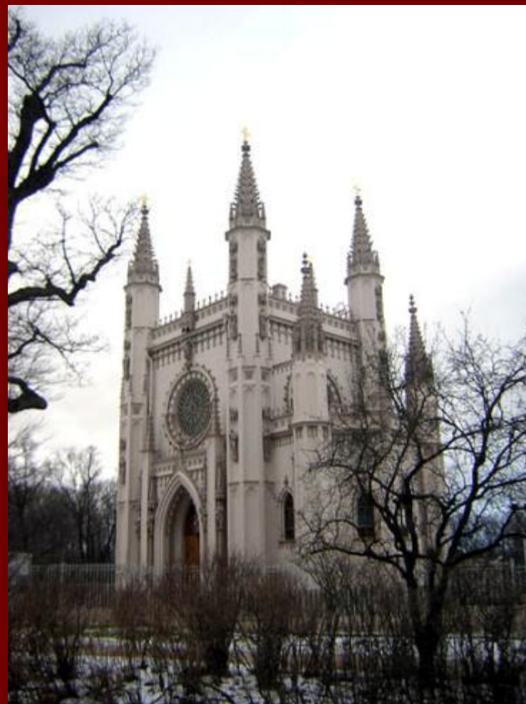
Готическая капелла парк Александрия Петергоф архитектор Карл Шинкель