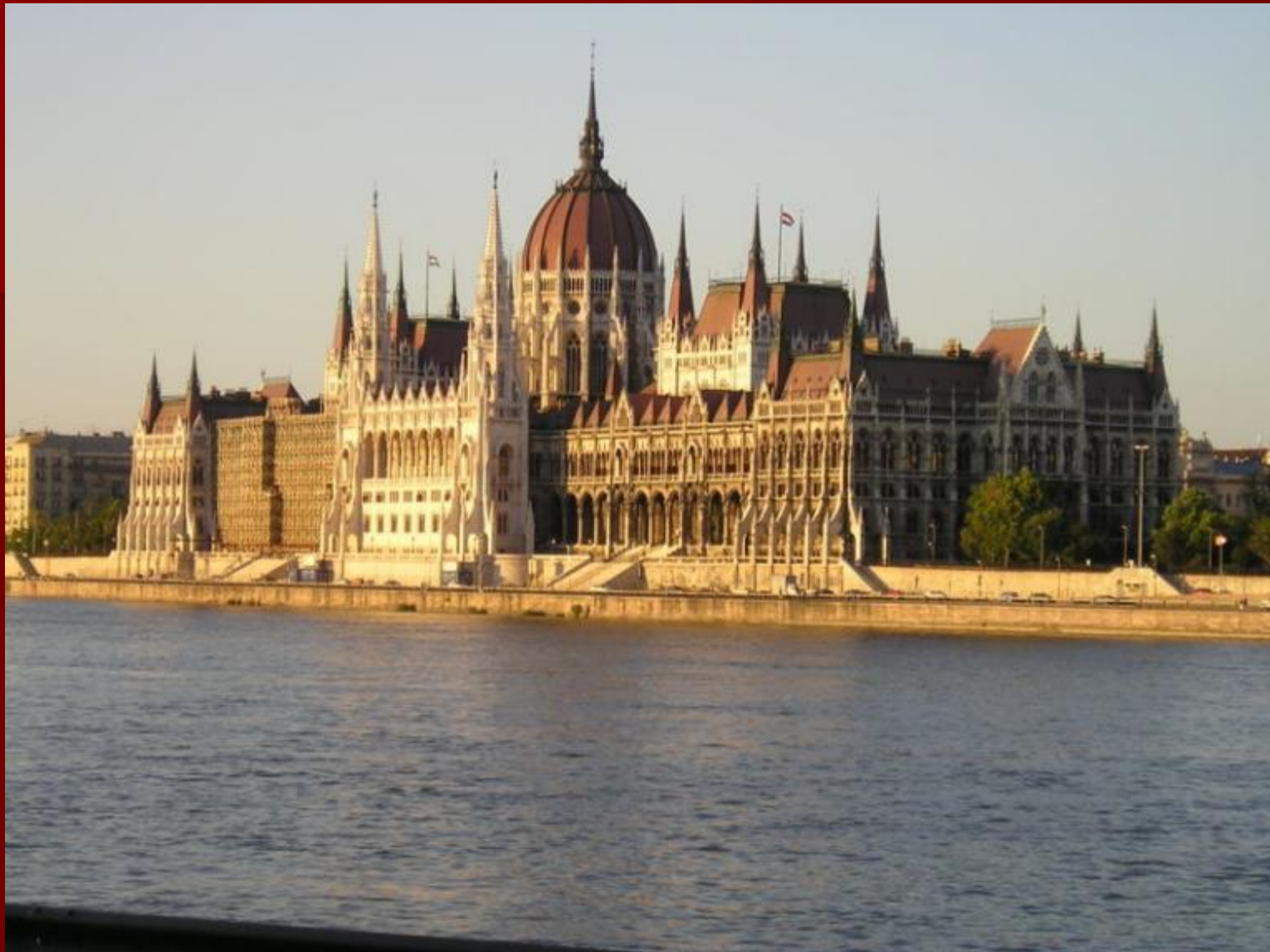
Парламент в Будапеште Архитектор Имре Штайндль