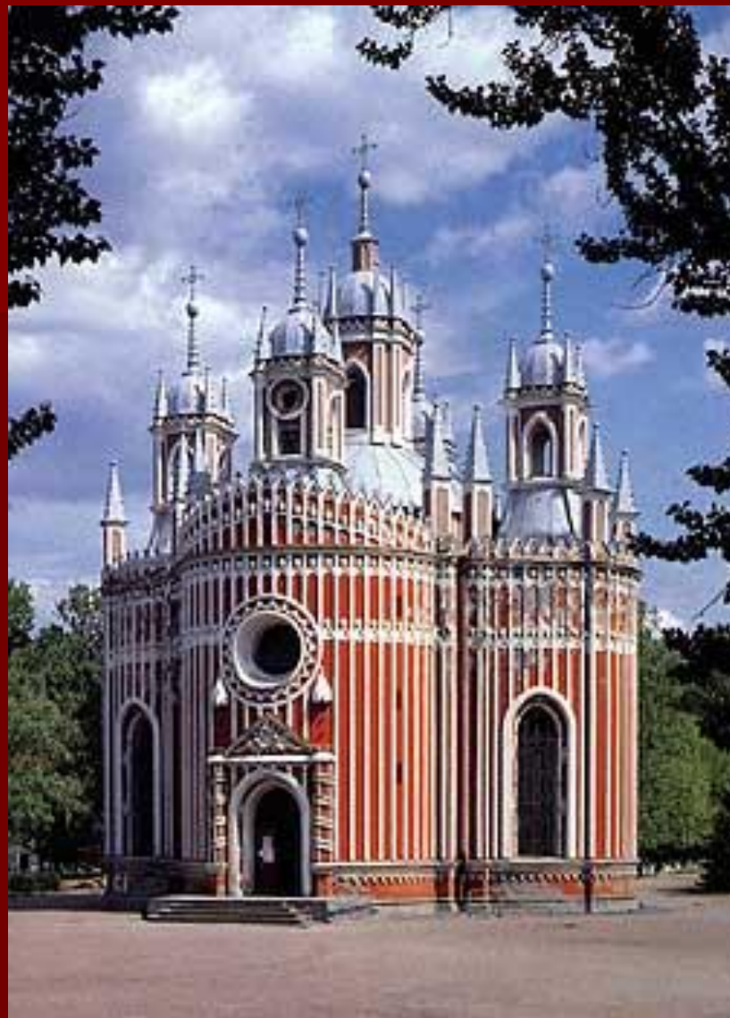
Чесменская церковь в Петербурге архитектор Юрий Фельтен