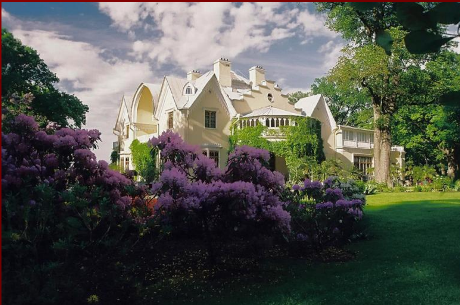
Коттедж в Петергофе архитектор Адам Менелас