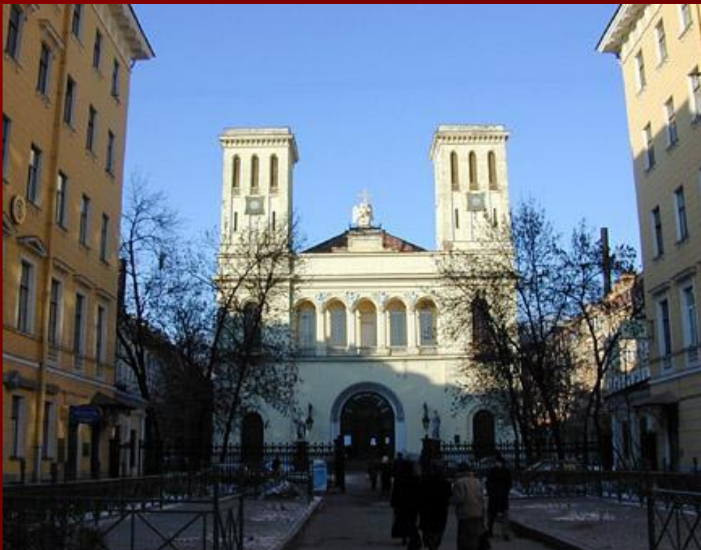
Лютеранская церковь в Петербурге Архитектор Александр Брюллов