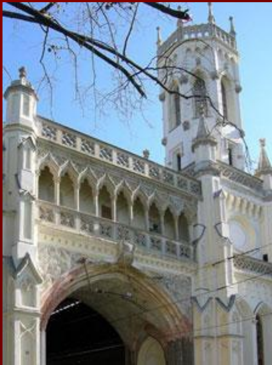
Вокзал в Петергофе архитектор Николай Бенуа