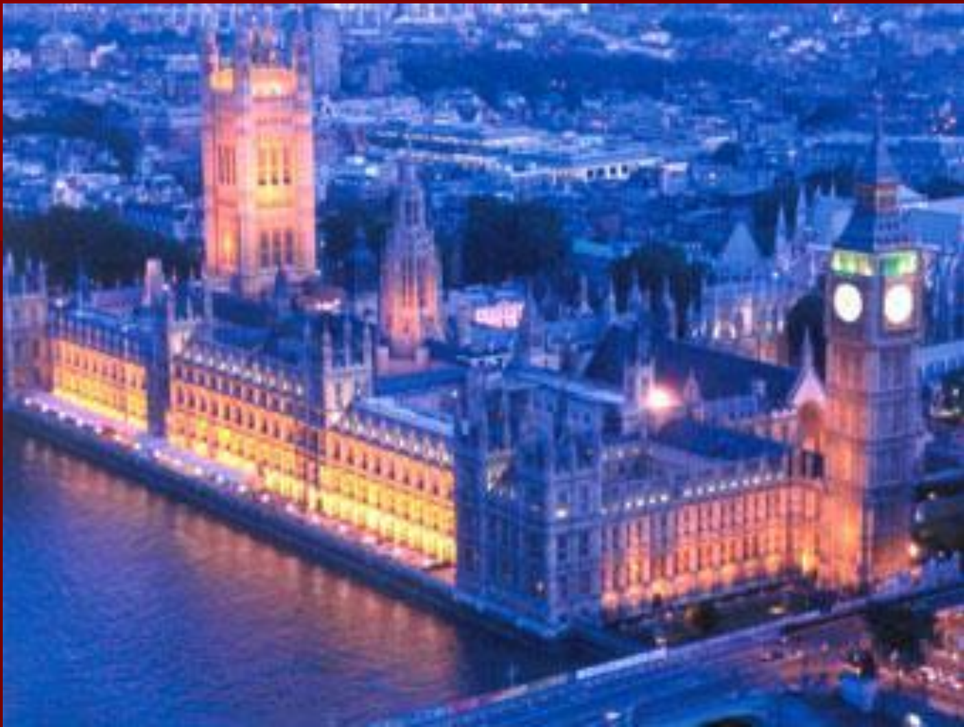
Британский парламент архитектор Чарльз Бэрри вид сверху в сумерках