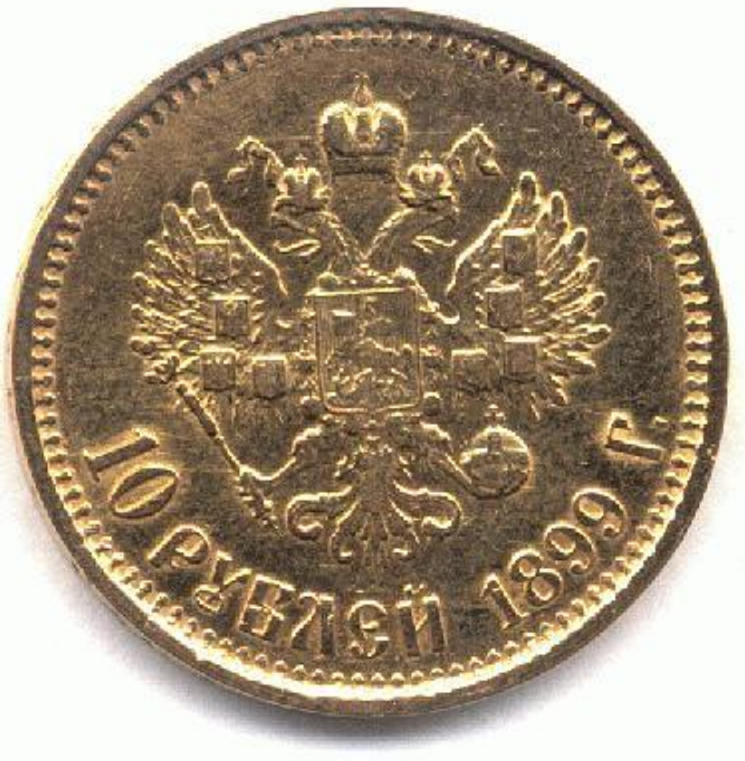
10-рублевая монета (чervонец) 1899 г.

1897 г. – денежная реформа. Установлен свободный обмен рубля на золото (золотой стандарт).