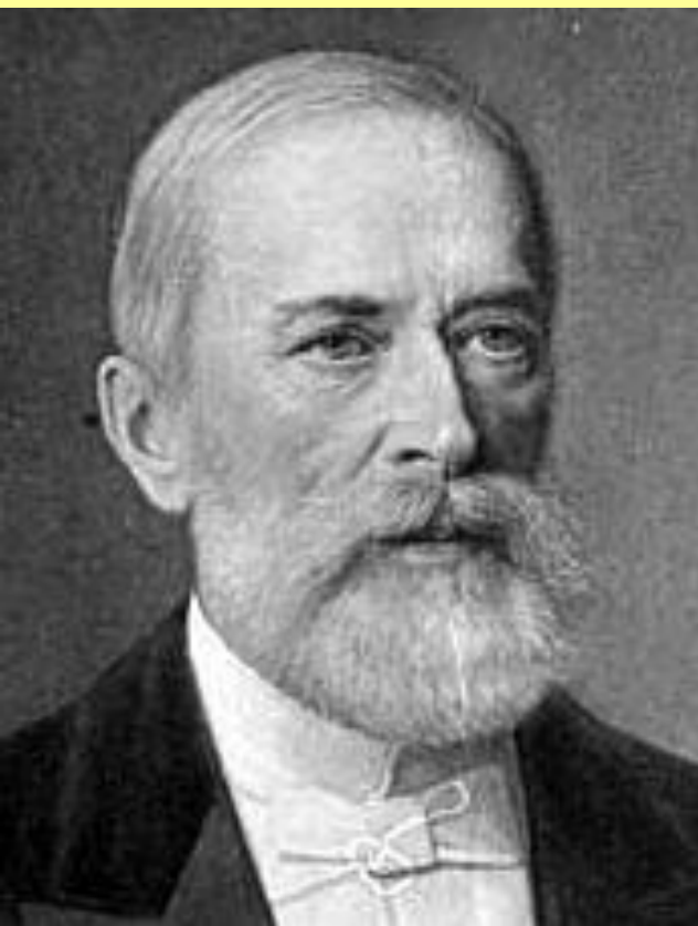
Николай Христианович Бунге (1823–), министр финансов в 1881–1886 гг.

Противник общины, сторонник переселения на окраины.