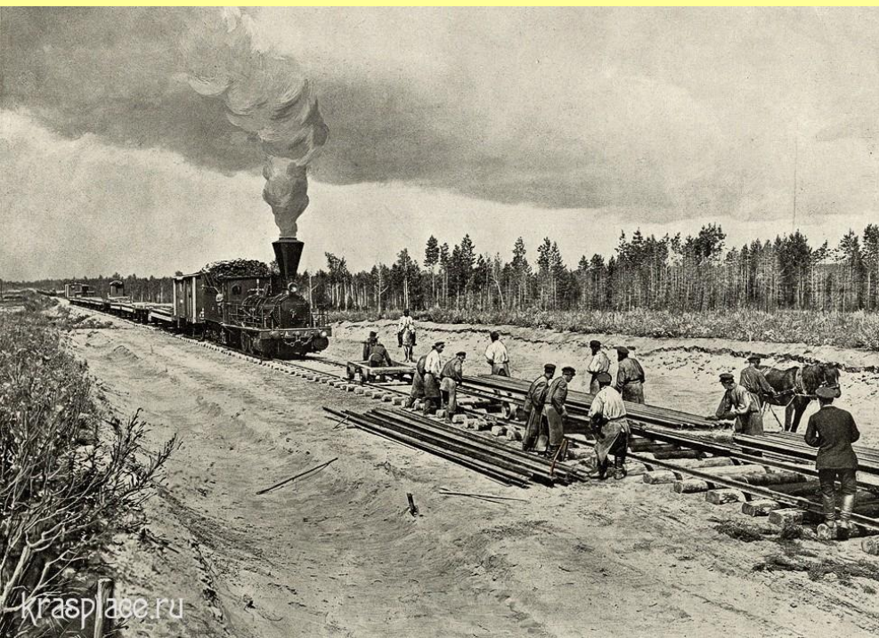
Строительство Транссибирской магистрали

В 1891 г. началось строительство Транссибирской магистрали, не имевшее в мире аналогов по протяженности пути, размаху и сложности работ. Со второй половины 90-х гг. железные дороги, прежде убыточные, стали давать казне чистый доход.