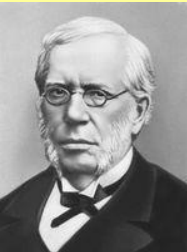
Вышнеградский Иван Алексеевич (1830–1895), министр финансов в 1886–1892 гг.

В остальном Вышнеградский продолжил политику Бунге.