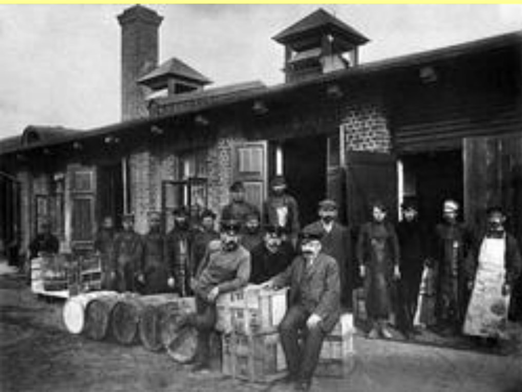
Казенный винный склад. Группа администрации с рабочими. Нижний Новгород. 1890-е гг.

С 1894 г. продажа спирта, водки и крепких вин объявлена монополией государства.