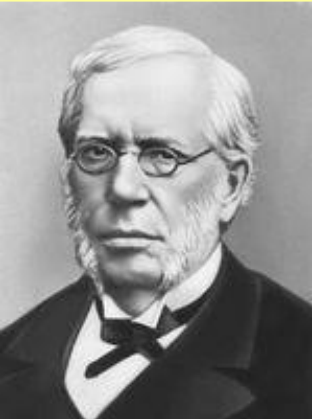
Вышнеградский Иван Алексеевич (1830–1895), министр финансов в 1886–1892 гг.

Известный ученый-механик. Одновременно – крупный делец. 1890 г. – сокращение полномочий фабричной инспекции, разрешение ночного труда женщин и подростков, найма на работу детей с 10 лет.