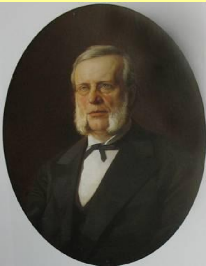
Вышнеградский Иван Алексеевич (1830–1895), министр финансов в 1886–1892 гг.

Ради пополнения казны Вышнеградский поощрял экспорт хлеба: