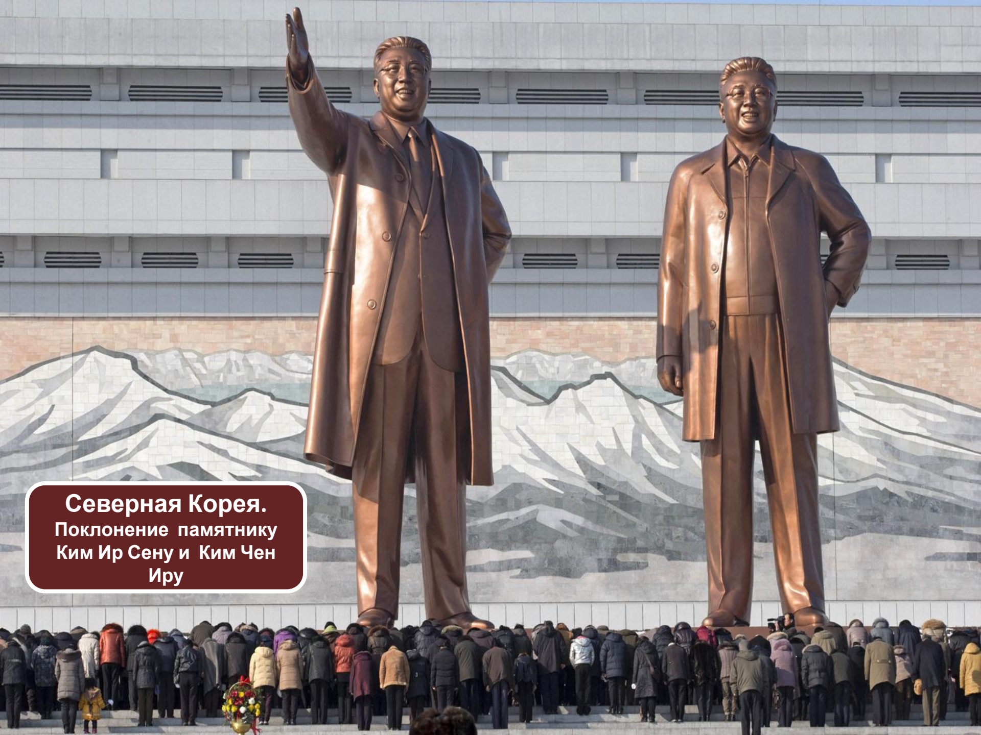
Северная Корея. Поклонение памятнику Ким Ир Сёну и Ким Чен Иру