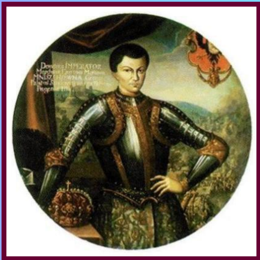
Лжедмитрий I. Миниатюра н.17 в.

В 1604 г.в Польше объявился Лжедмитрий. Это был беглый монах Григорий Отрепьев. Заручившись поддержкой поляков (в обмен на Псков, Новгород, Новгород-Северский, Чернигов и брак с Мариной Мнишек), он двинулся на Москву во главе небольшого отряда.