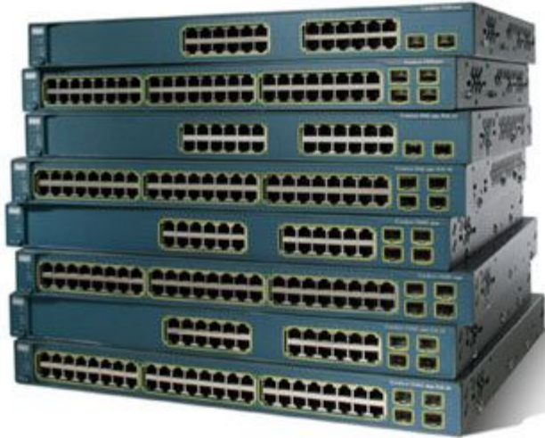
1 Коммутатор Cisco Catalyst 3560