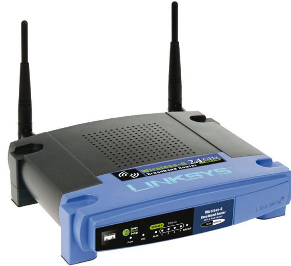
6 Wifi коммутаторов