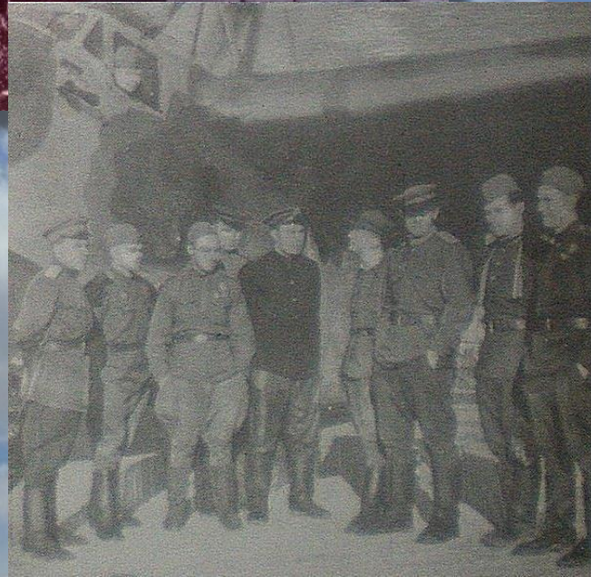
Пилоты и техники авиаполка

В 1941-1944 годах мужественно защищали Мурмаши, Туломскую ГЭС и подступы к Мурманску летчики 147 истребительного (позднее 20 Гвардейского ) авиаполка . В составе этого полка сражалась эскадрилья «Комсомолец Заполярья» , деньги на строительство самолетов были собраны молодежью Мурманской области.