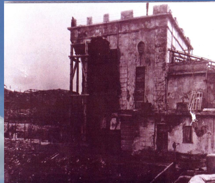
Туломская ГЭС в годы войны

Кроме того, здесь была Туломская ГЭС, которая в дни войны приобрела исключительное значение. Она питала электрической энергией Мурманск, морской порт, железную дорогу.