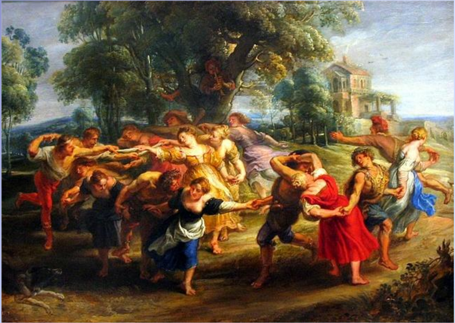
Крестьянский танец. Рубенс