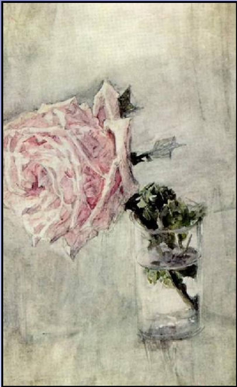
Роза. Врубель М.А.