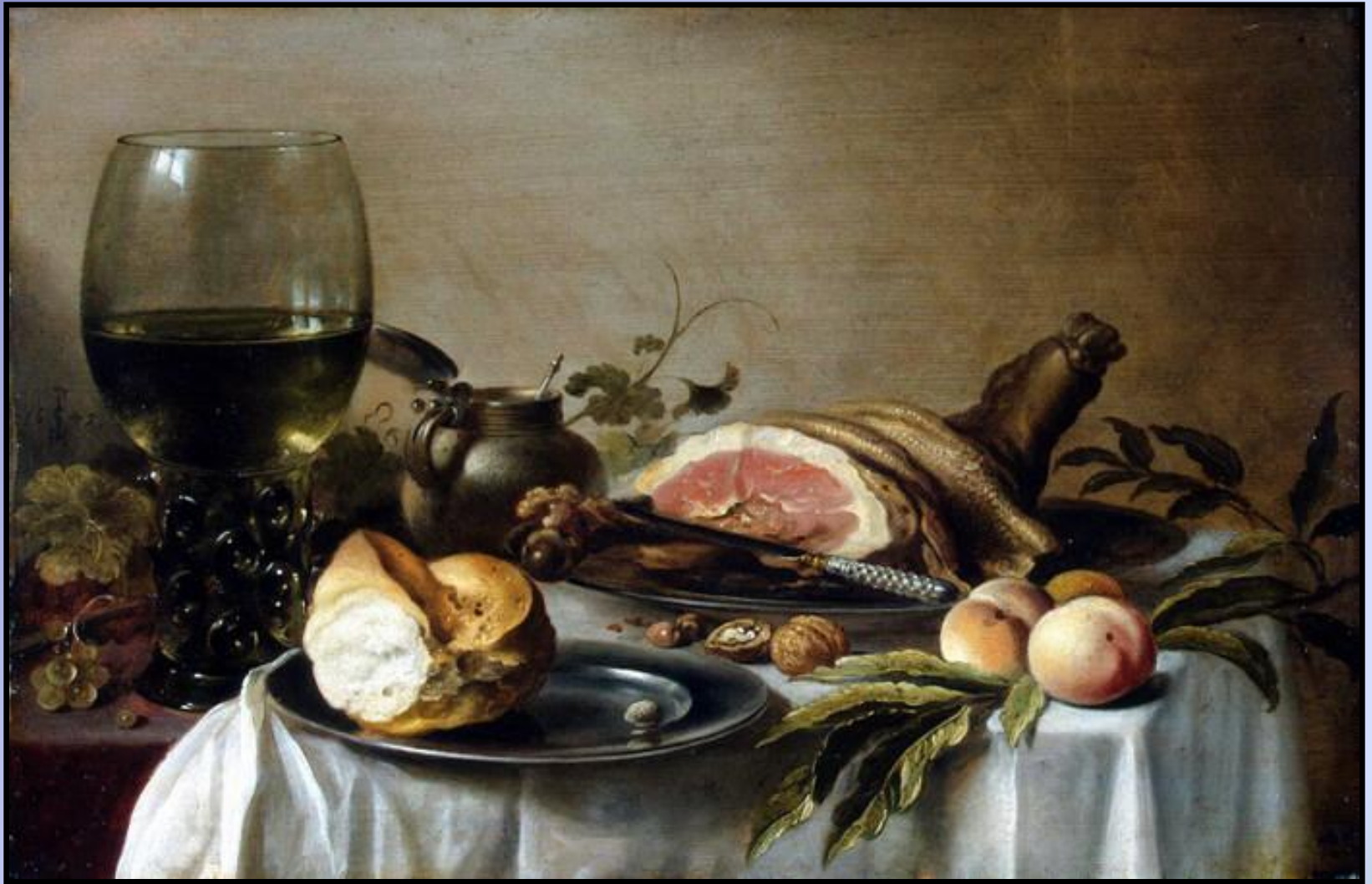
Питер Клас. Голландия XVII в.