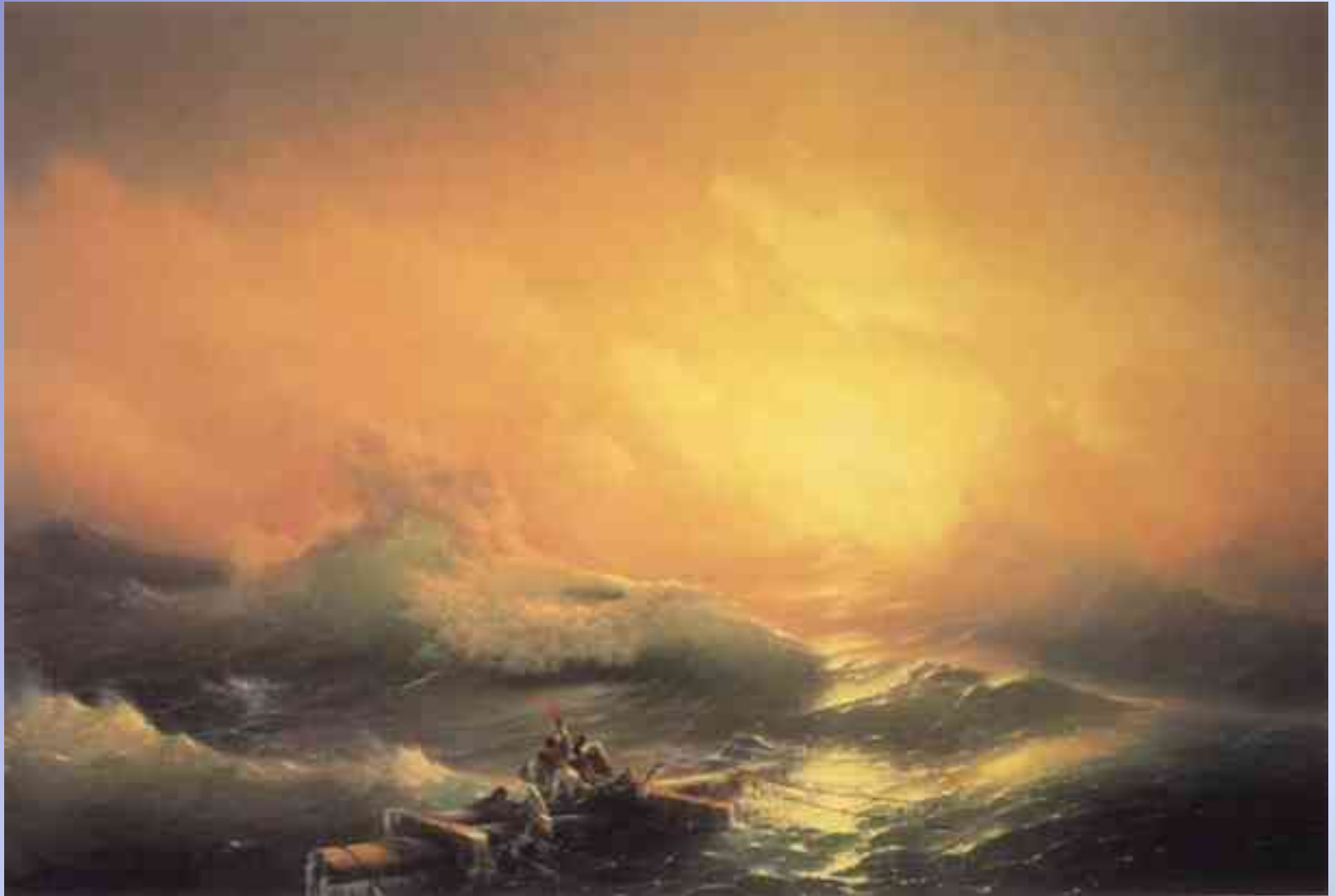
Морской пейзаж (марина)