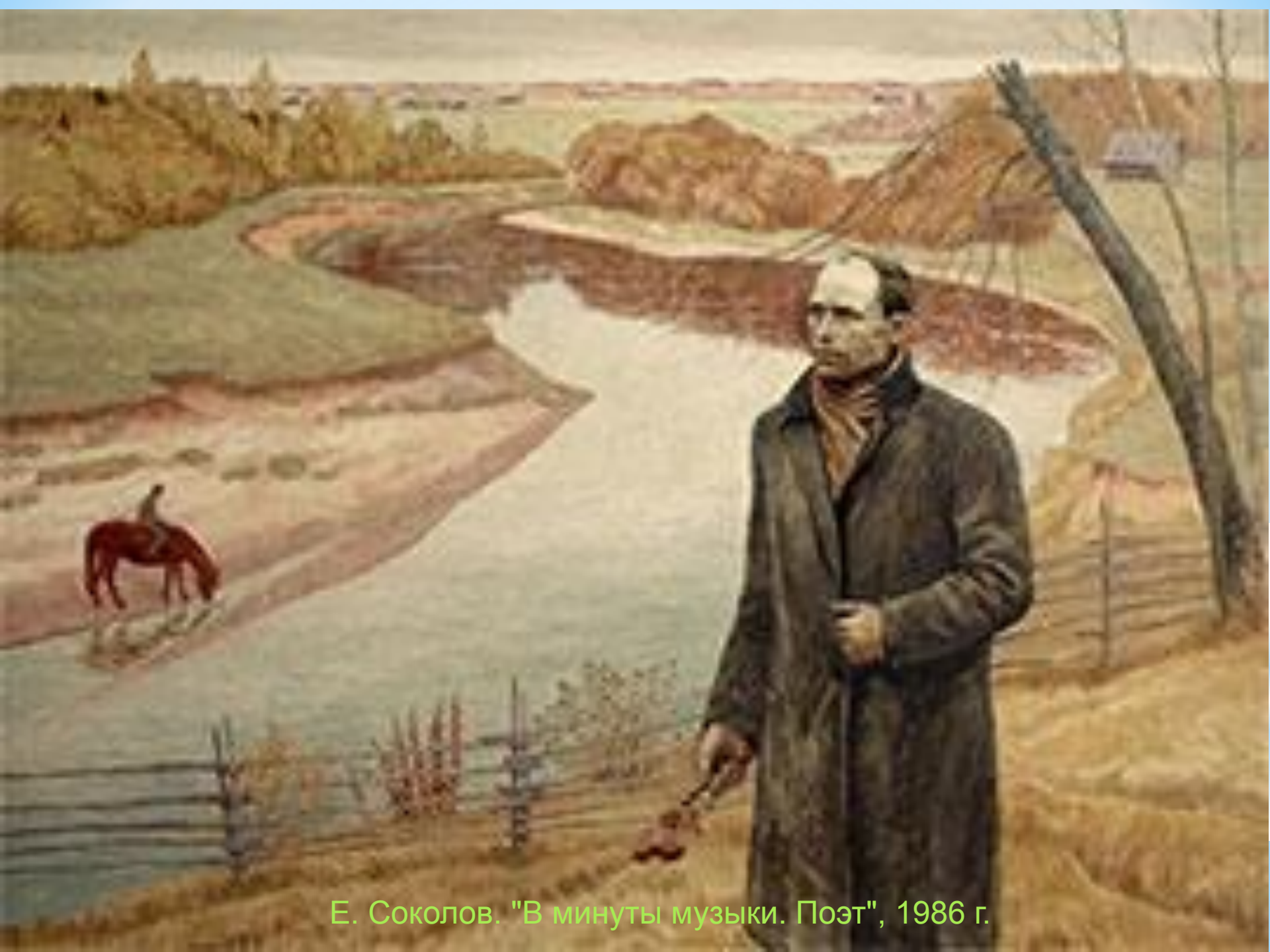
Е. Соколов. "В минуты музыки. Поэт", 1986 г.