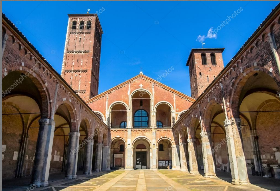
Церковь Сант-Амброджо в Милане