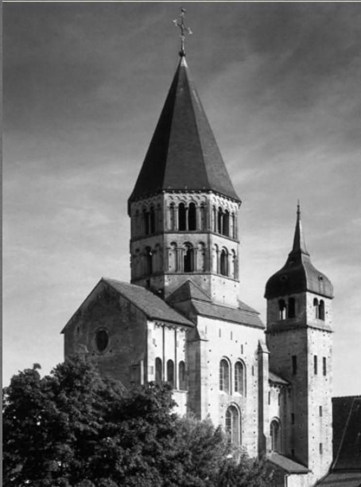
Монастырь Клуни. XI—XII вв.