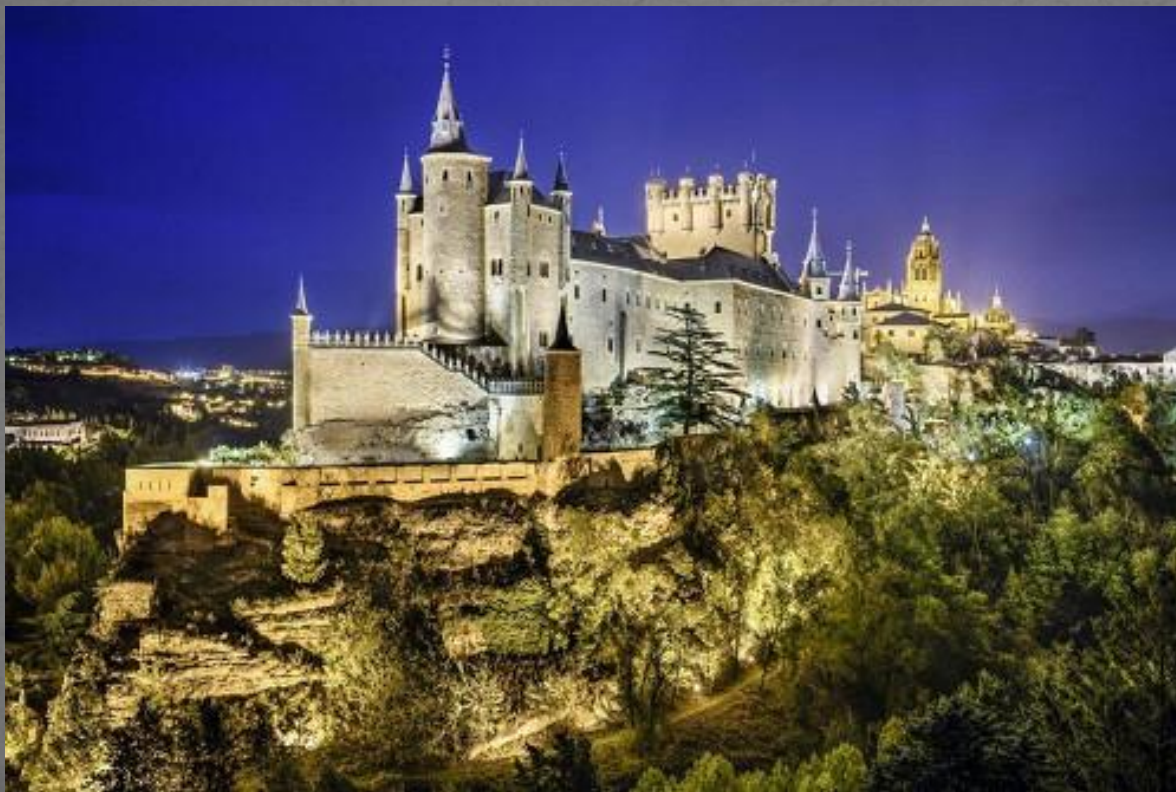
Замок Алькасар. IX в.