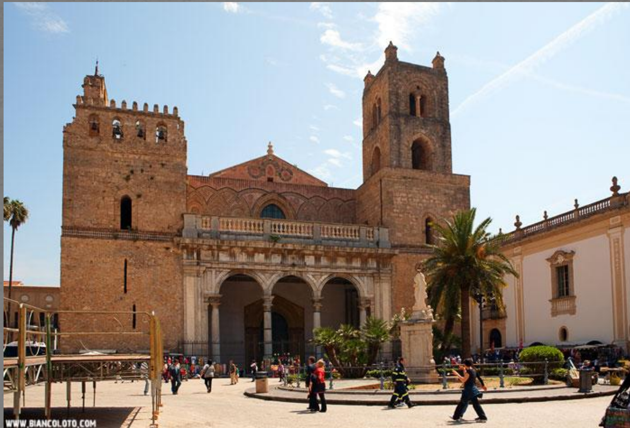
Собор Санта-Мария Нуова. 1174—1189 г.