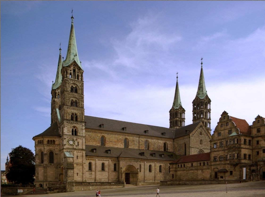
Собор в Бамберге (1185 г. — XIII в.)