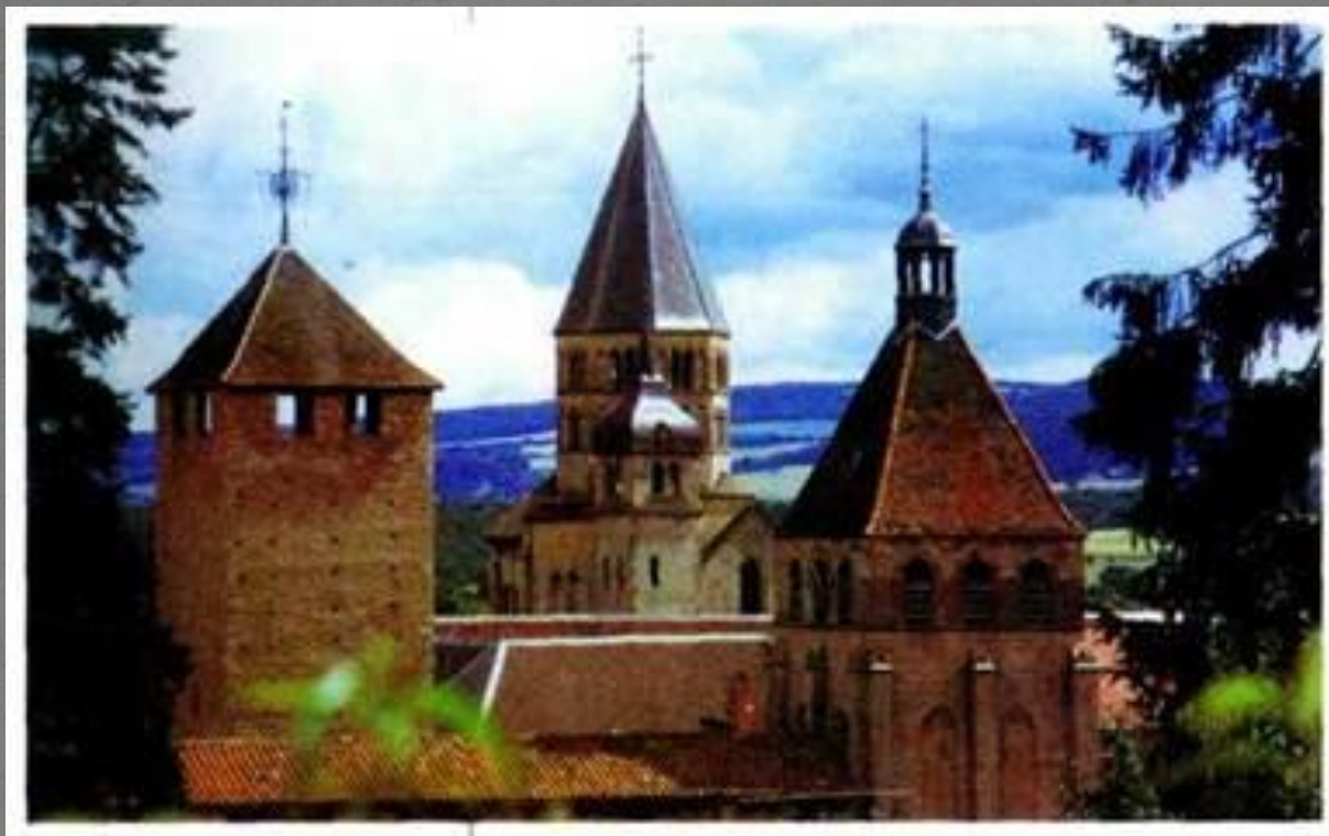
Монастырь Кюни. XI—XII вв.