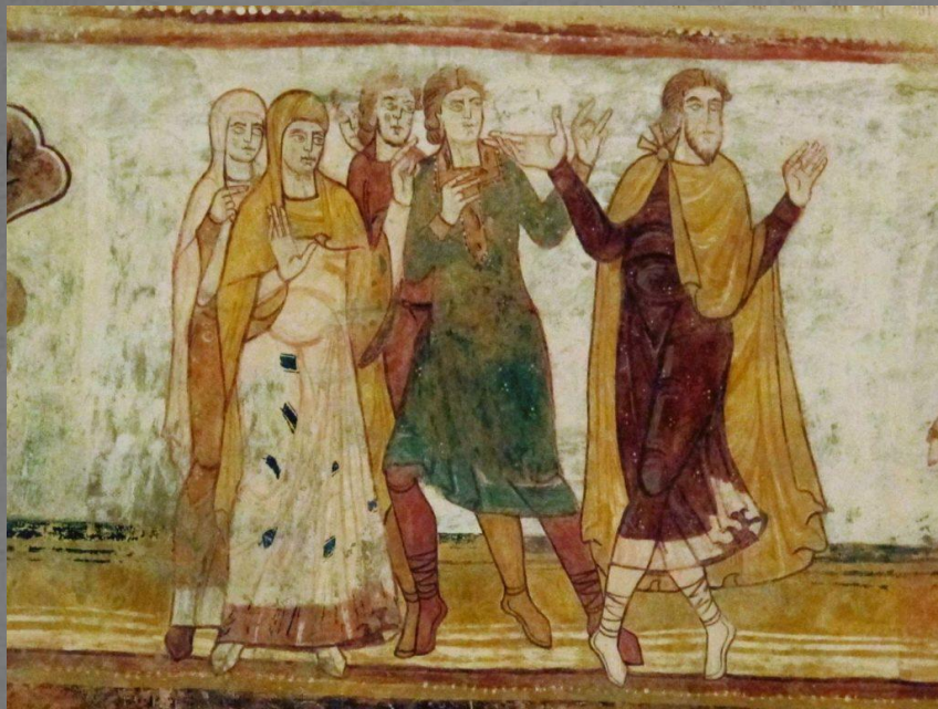
Фрагмент фресковой росписи на сюжет Ветхого Завета