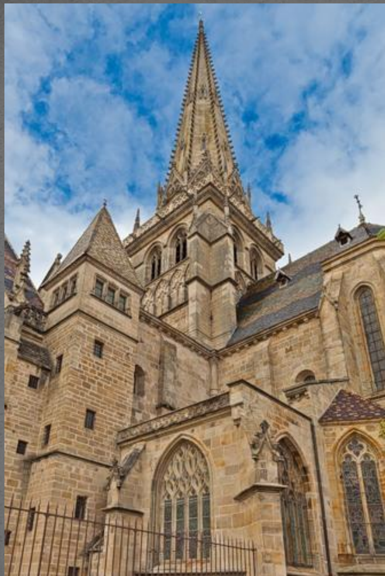
церковь Сен-Лазар в Отене (1112—1132 гг.)