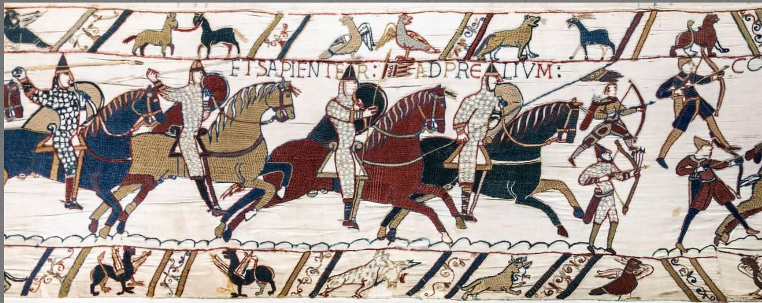
Битва при Гастингсе. Ковёр из Байё. Около 1077 г.