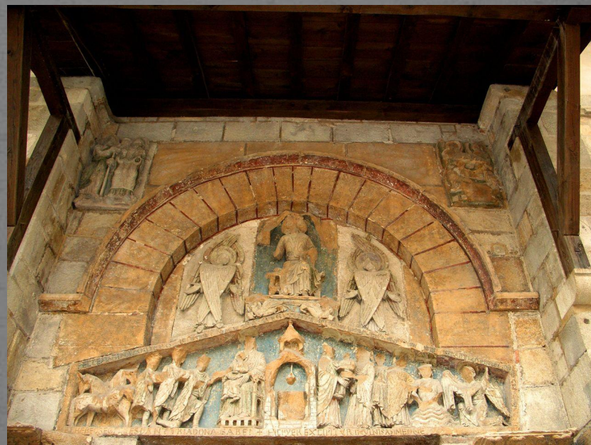
Нотр-Дам-дю-Пор в Клермоне (XII в.)