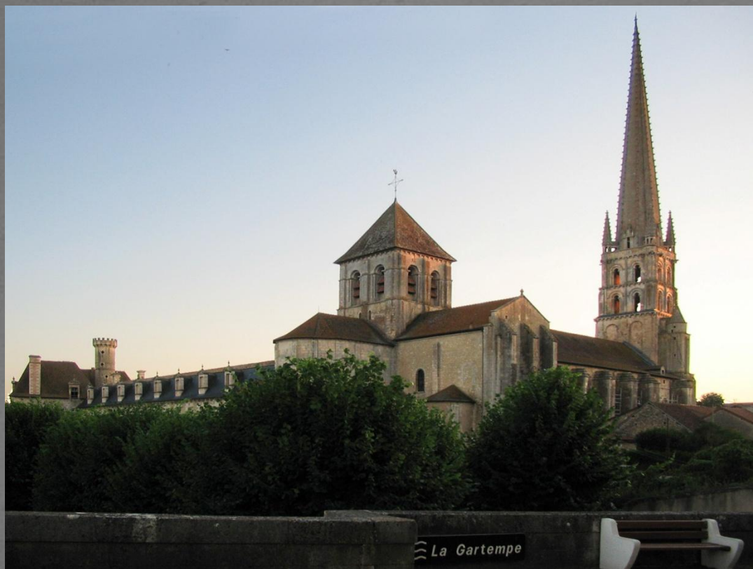
Сен-Савен-сюр-Гартан (конец XI в. — 1115 г.)