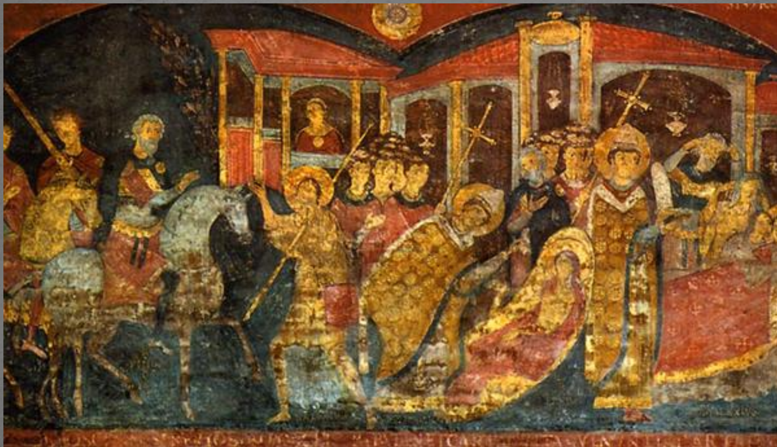
Фрески церкви Сан-Клементе (1073—1084 гг.)