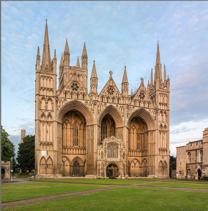
Питерборо (конец XII в.)