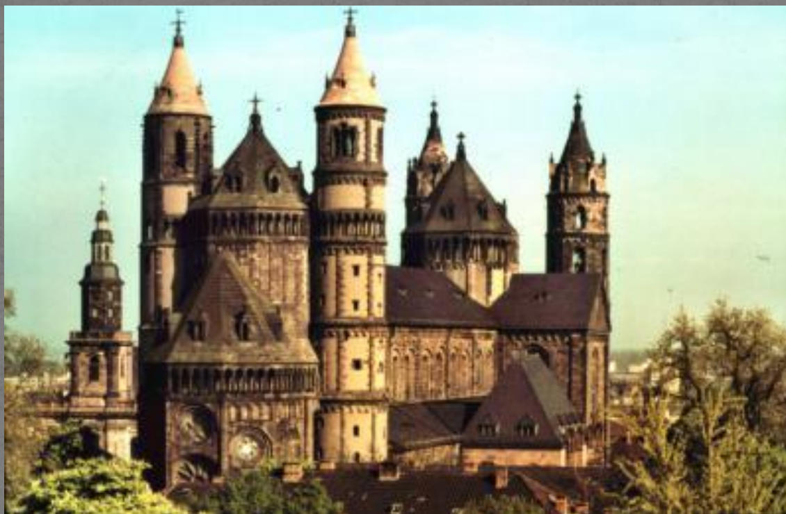
Собор в Вормсе. 1181 — 1234 гг.