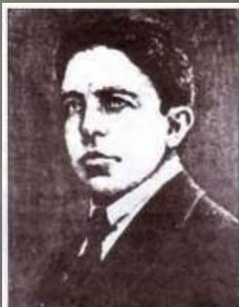
Осип Твердовський, учасник бою під Крутами.