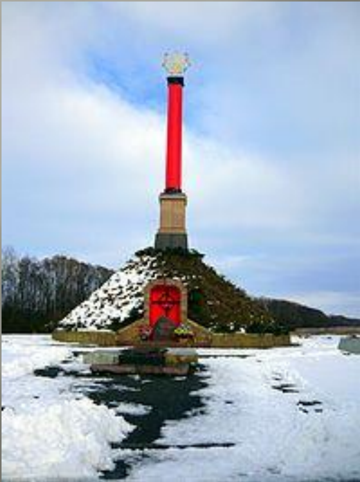
Монумент битви під Крутами

Тут береже Україна вічний сон молодих своїх синів, які загинули героїською смертю в боротьбі за її волю під Крутами 29 січня 1918 року