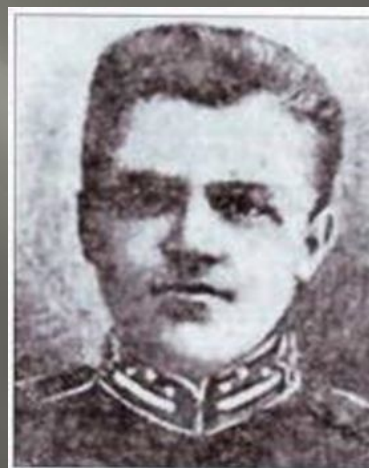
Аверкій Гончаренко, командуючий боєм під Крутами.