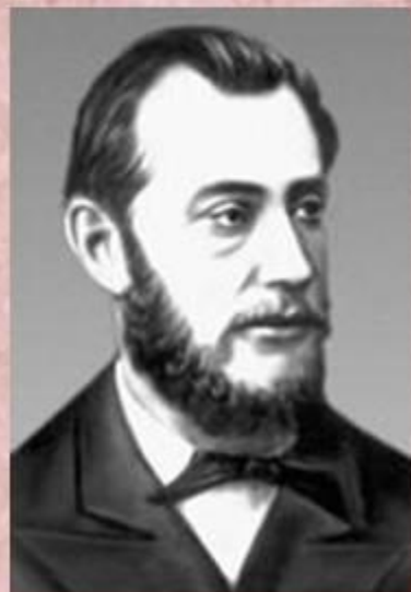
М. А. Натансон