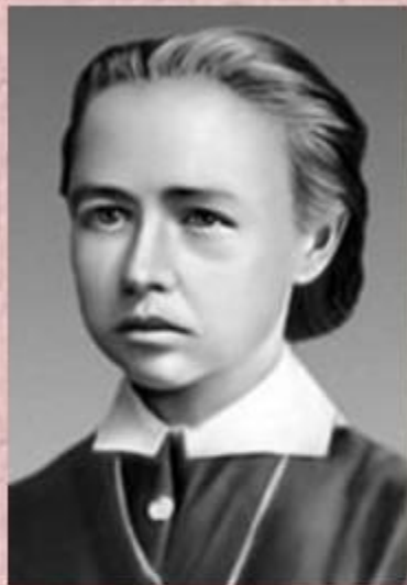
С. Л. Перовская