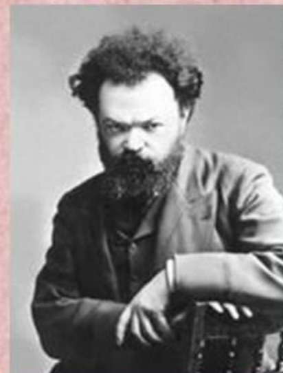
С. М. Кравчинский