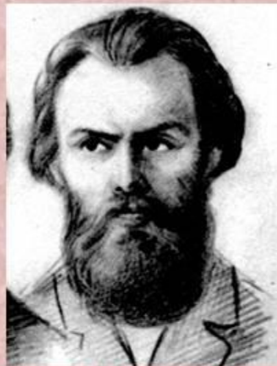
А. И. Желябов