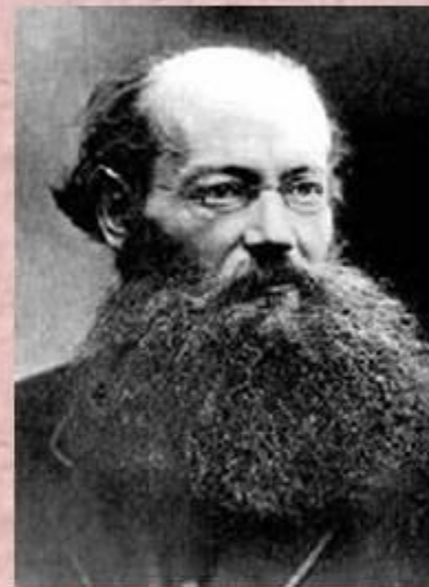
П. А. Кропоткин