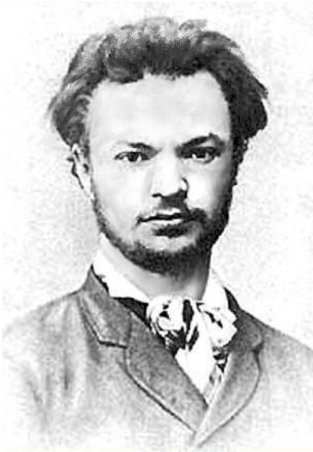
Сергей-Михайлович Кравчинский (Степняк) (1851–1895).