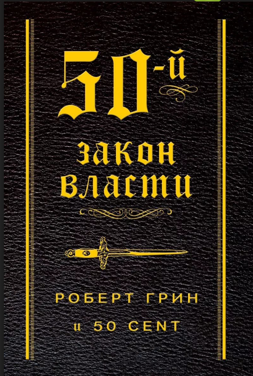
50 закон (feat. 50 cent)