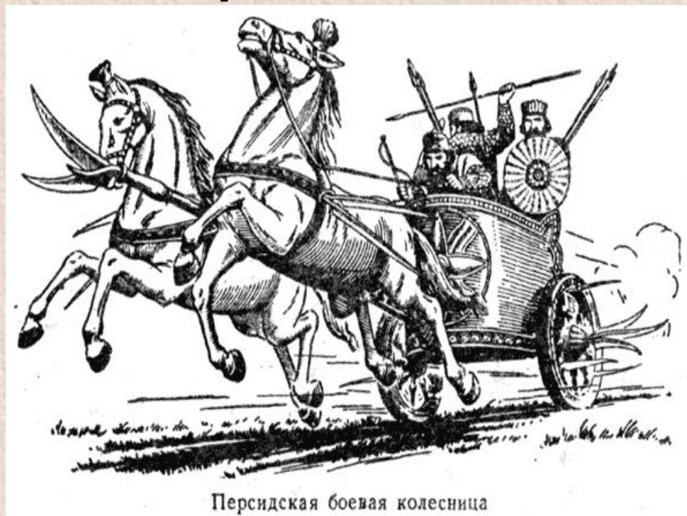
Персидская боевая колесница