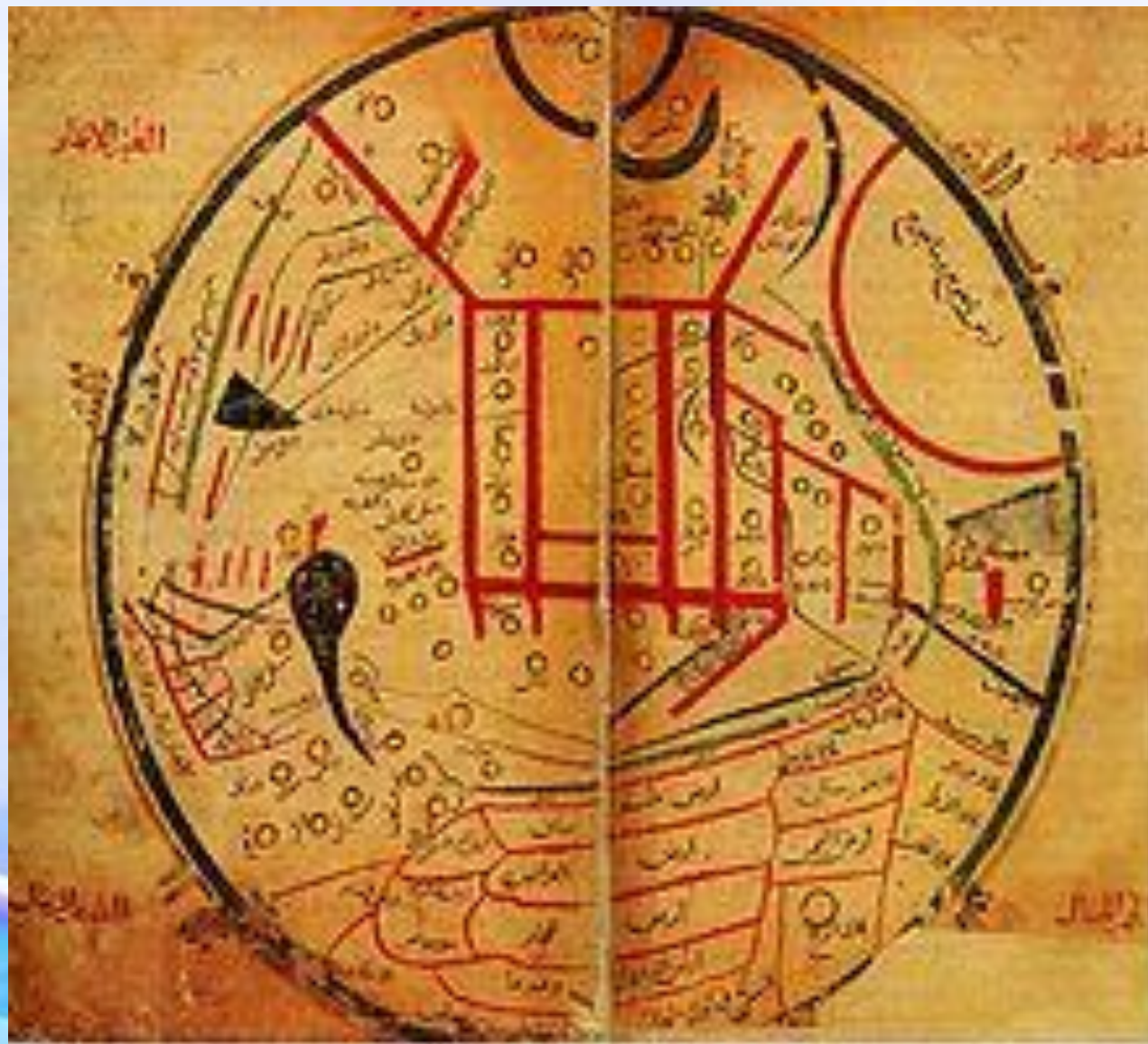
Түрк әлемі Махмұду Қашғари (XI ғасыр)