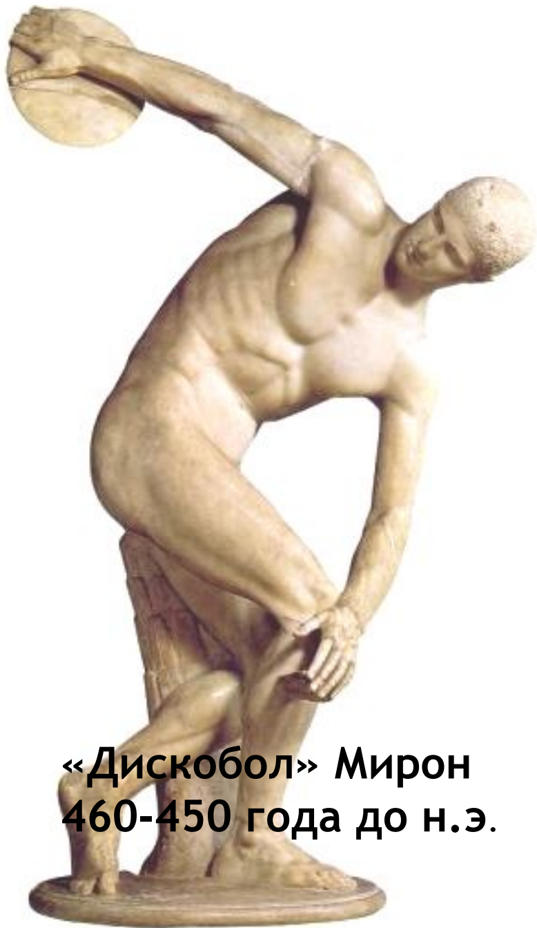
«Дискобол» Мирон 460-450 года до н.э.