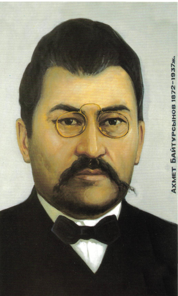
АХМЕТ БАЙТУРСЫНОВ 1872-1937ж.