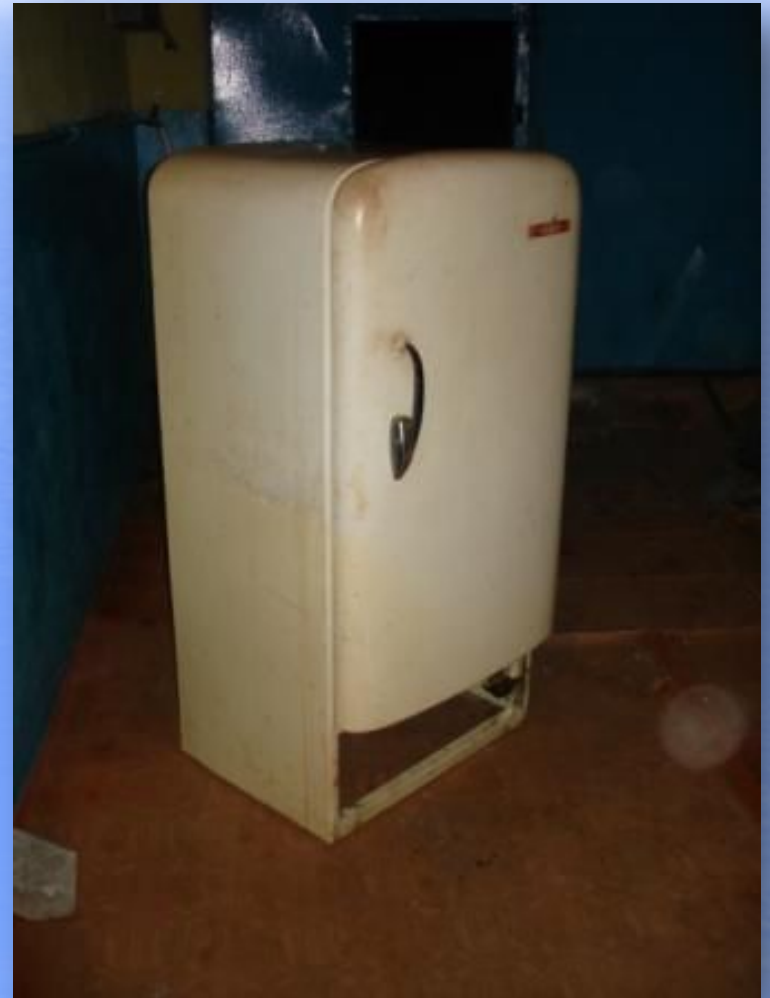
Холодильник «Мир», 1960 г