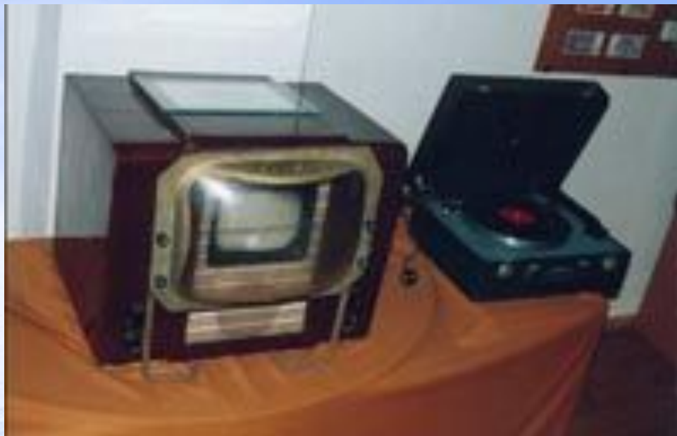
Телевизор ВЭЛС в конце 50-х гг

КВН-49 (Кенигсон, Варшавский, Николаевский — 1949 г.) — чёрно-белый телевизор, выпускавшийся в СССР в различных модификациях с 1949 по 1960 год