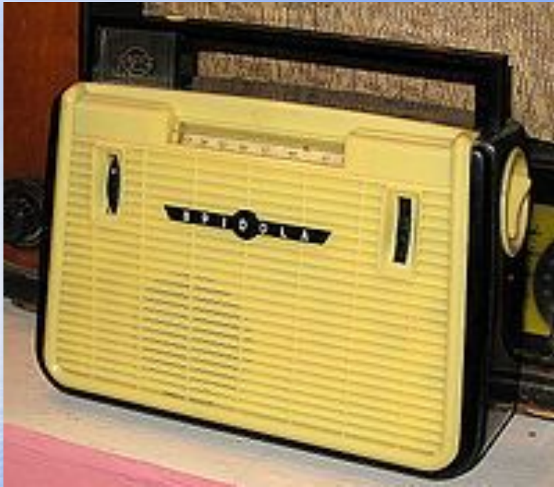
Радиоприёмник «Spidola» модели 1960 г