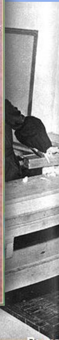
Сегодня в школе-интернате урок труда