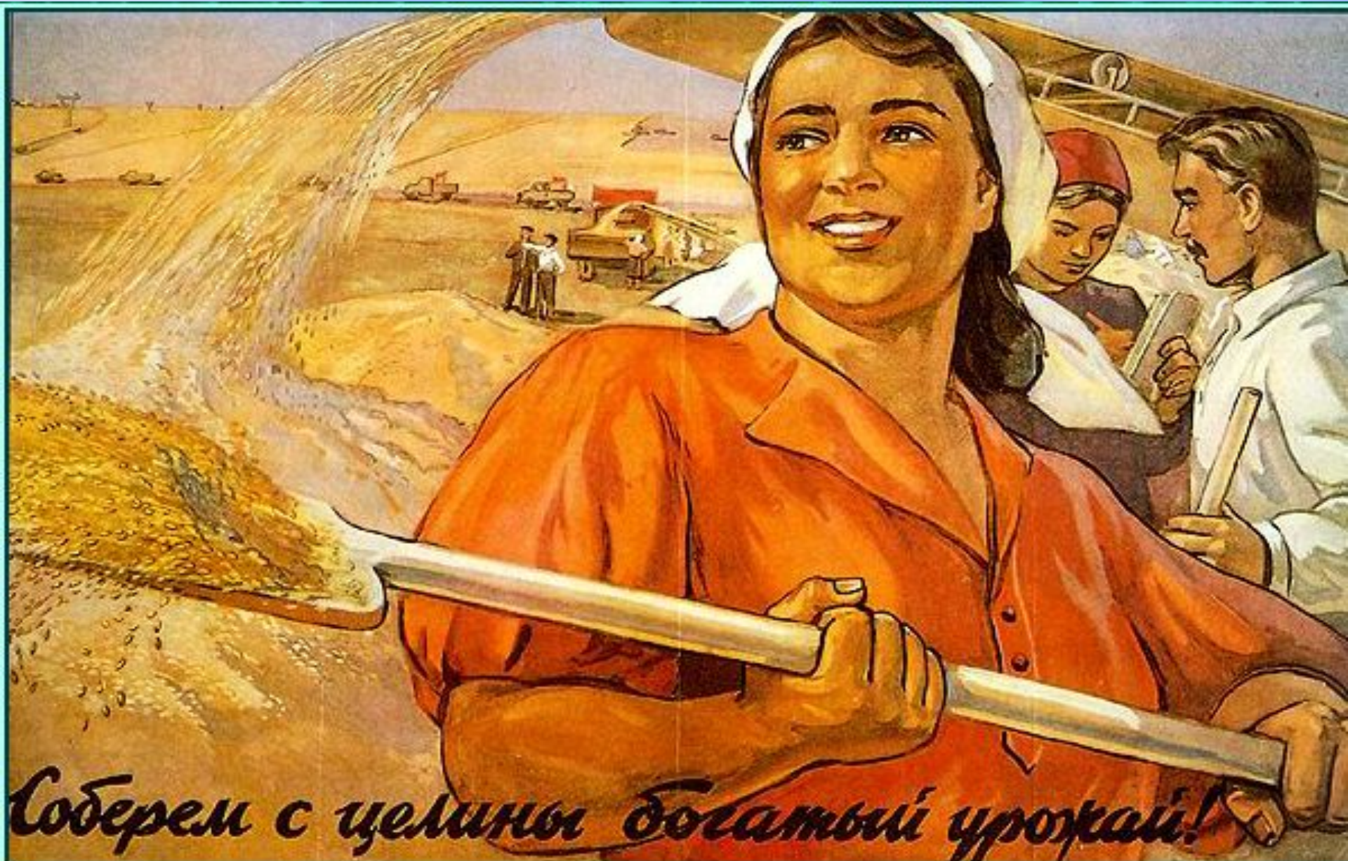
Плакат В.Корецкого, К.Иванова, О.Савостюк, Б.Успенского. 1954 год