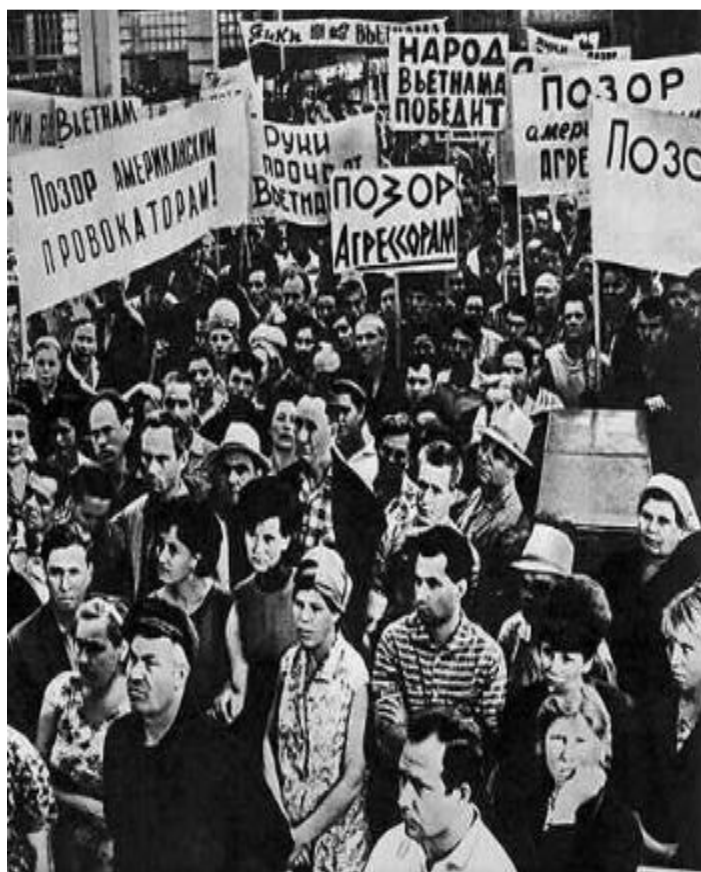
Митинг на АЗЛК против войны во Вьетнаме.

В сер.60-х гг.международная обстановка осложнилась. Война во Вьетнаме привела к обострению отношений СССР и США. Идеологические споры с Китаем привели к территориальным претензиям с его стороны и в 1969 г. произошел вооруженный конфликт из-за о.До манский. Критика сталинизма привела к конфликту с Китаем,Кореей и Албанией,а его «реабилитация» к спорам с компартиями Западной Европы.