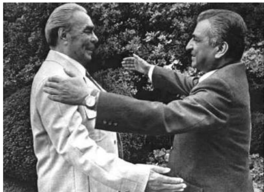
Л.Брежнев и Б.Кармаль.

СССР надеялся, что освободившиеся страны пойдут по пути коммунизма. Особые надежды возлагались на Афганистан. В 1978 г. здесь к власти пришли прокоммунистические силы, но между их лидерами разгорелась борьба за власть. 25 декабря 1979 г. после долгих споров среди советских руководителей в Афганистан были введены советские войска для поддержания стабильности в регионе. Война обошлась в 1 млн. жертв для афганцев и 35 тыс. - для СССР.