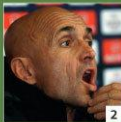
4 млн евро Лучано Спалетти «Зенит»