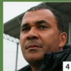
1,5 млн евро Руд Гуллит «Терек»