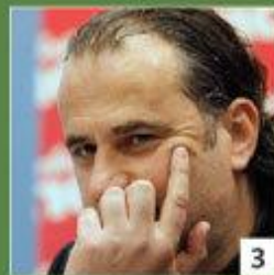
2 млн евро Миодраг Божович «Динамо»