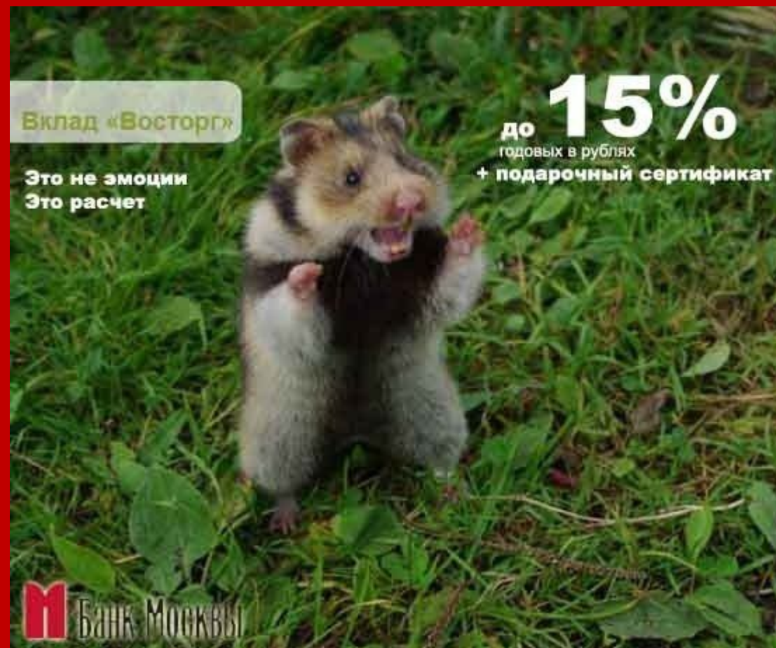
Одна из реклам Банка Москвы