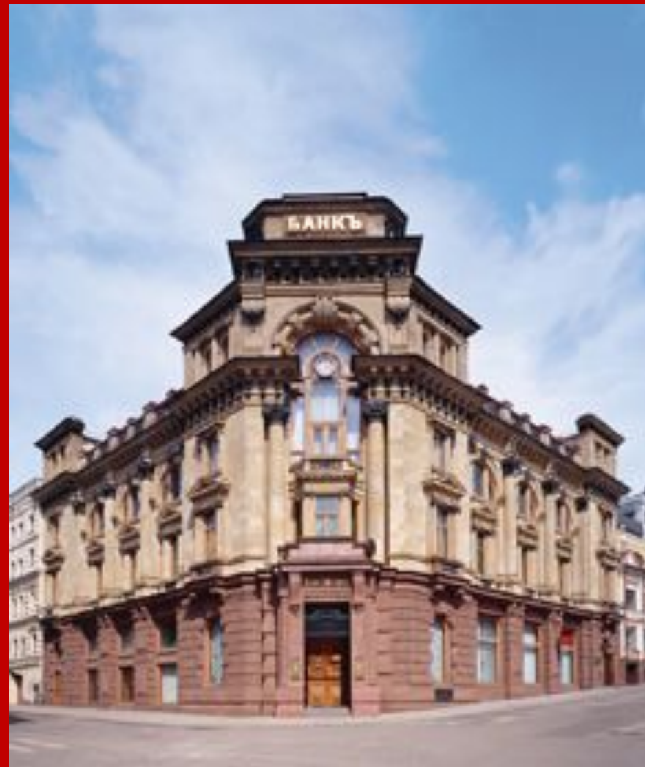
Головной офис Банка Москвы