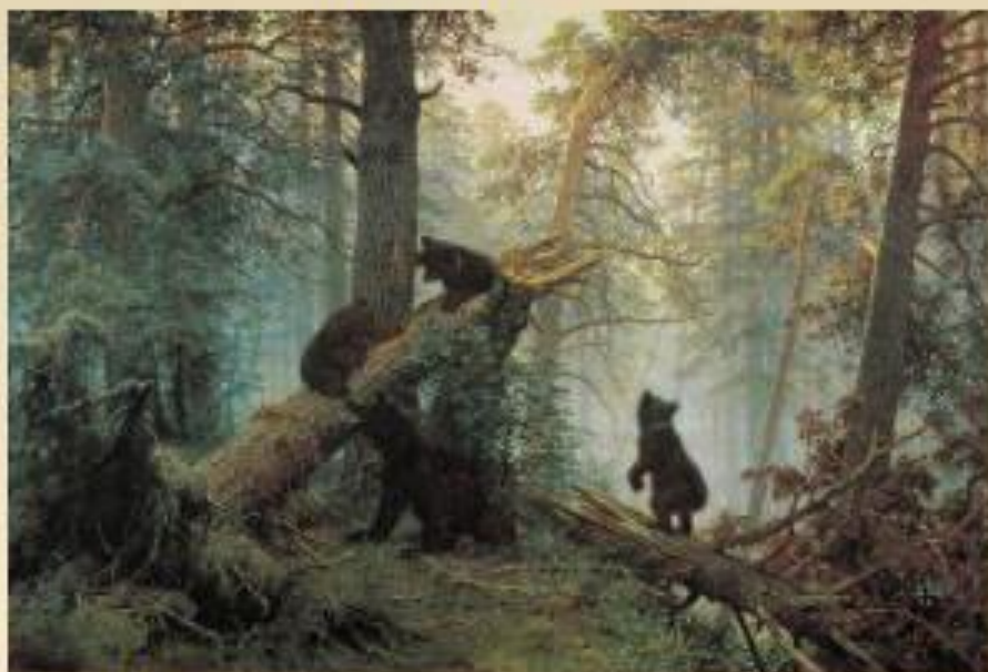
«Утро в сосновом лесу»