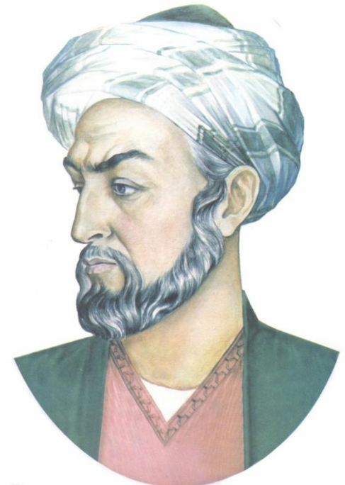
Абуали Сино - Авиценна