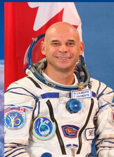
◆ Гі Лаліберте