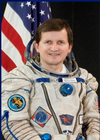
◆ Чарльз Сімони