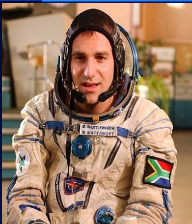
◆ Марк Шаттлворт