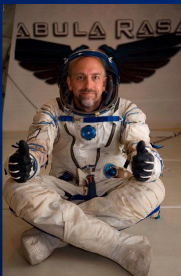
◆ Ричарда Гэрриота