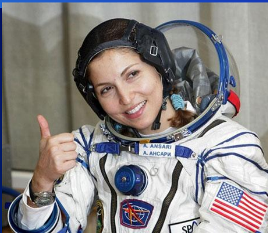
◆ Ануше Ансарі