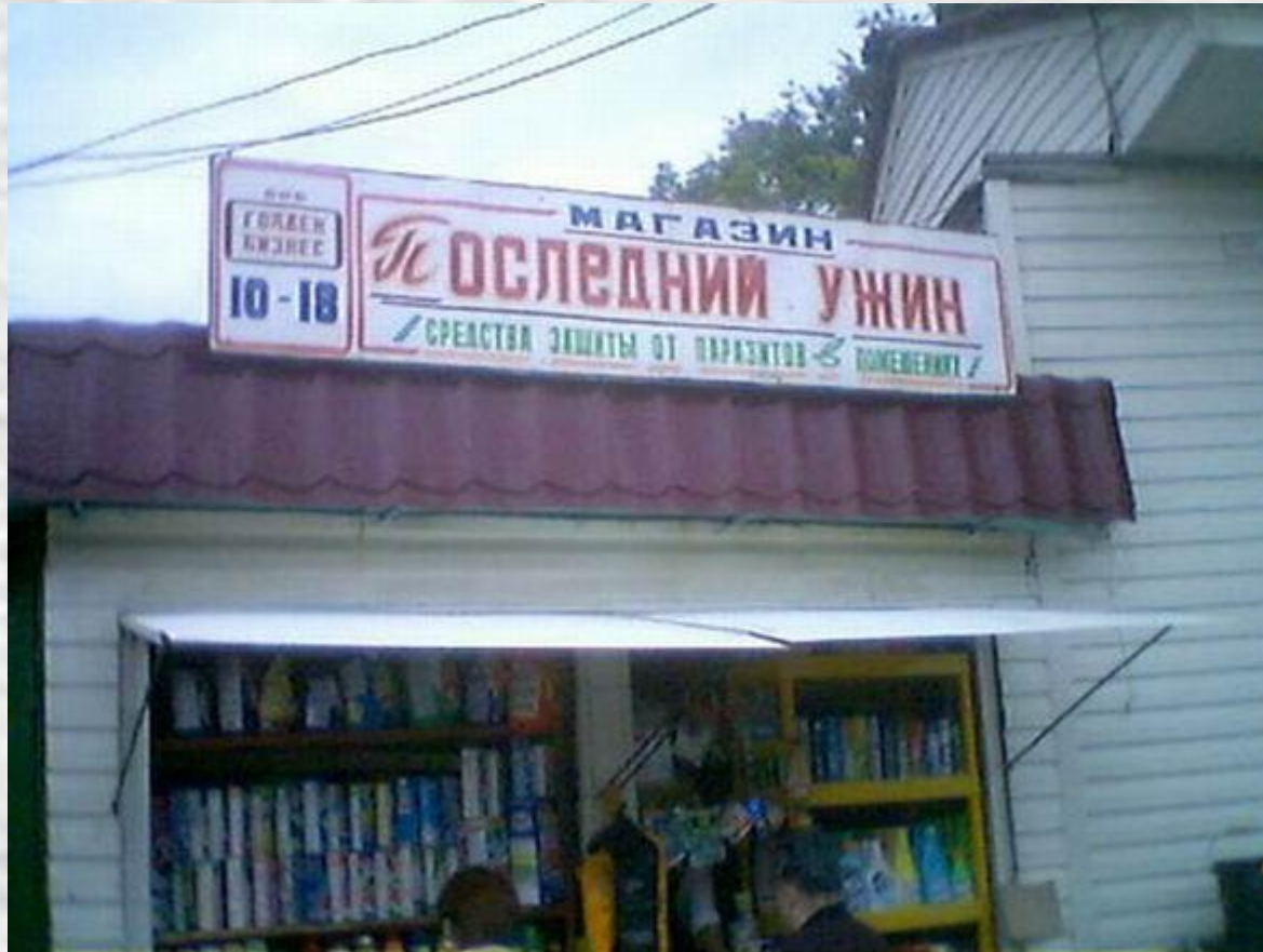
„Utolsó vacsora“ vegyesbolt – rovarirtó szerek – tisztító szerek