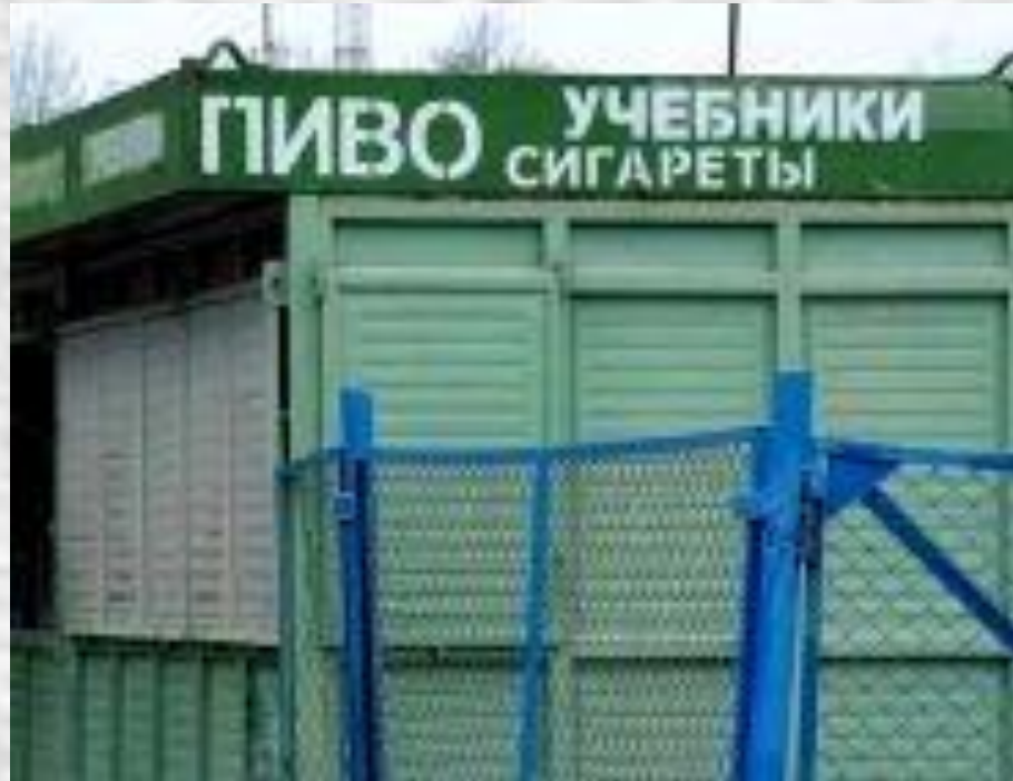
Sör – Tankönyv - Cigaretta