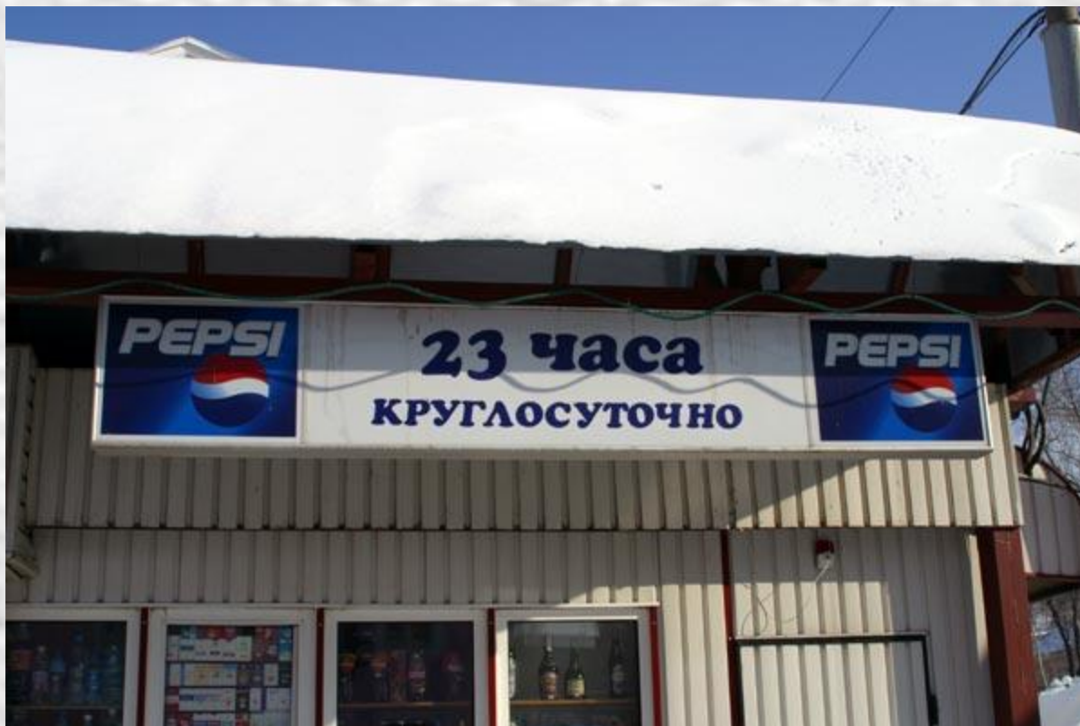
Non-stop 23 óra