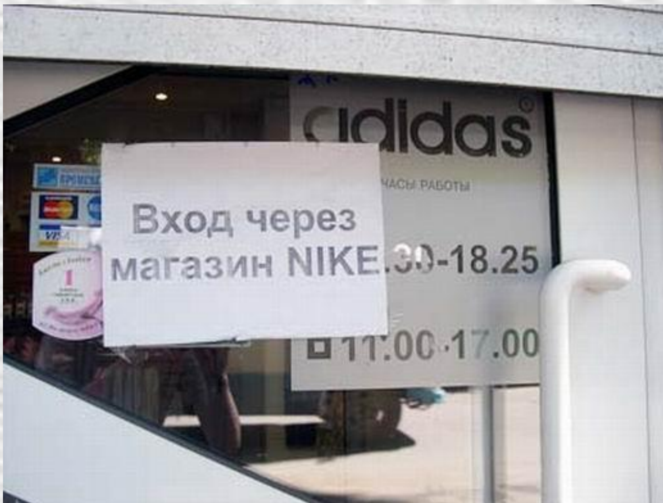
Adidas – bejárat a Nike boltból