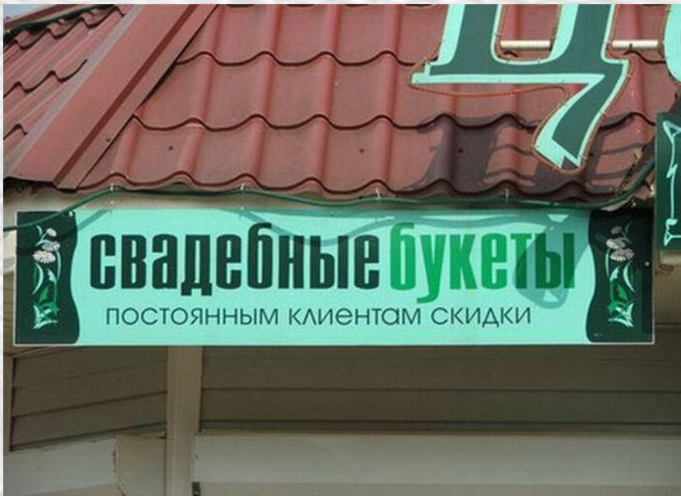
Esküvői csokrok – törzsvásárlóknak kedvezmény