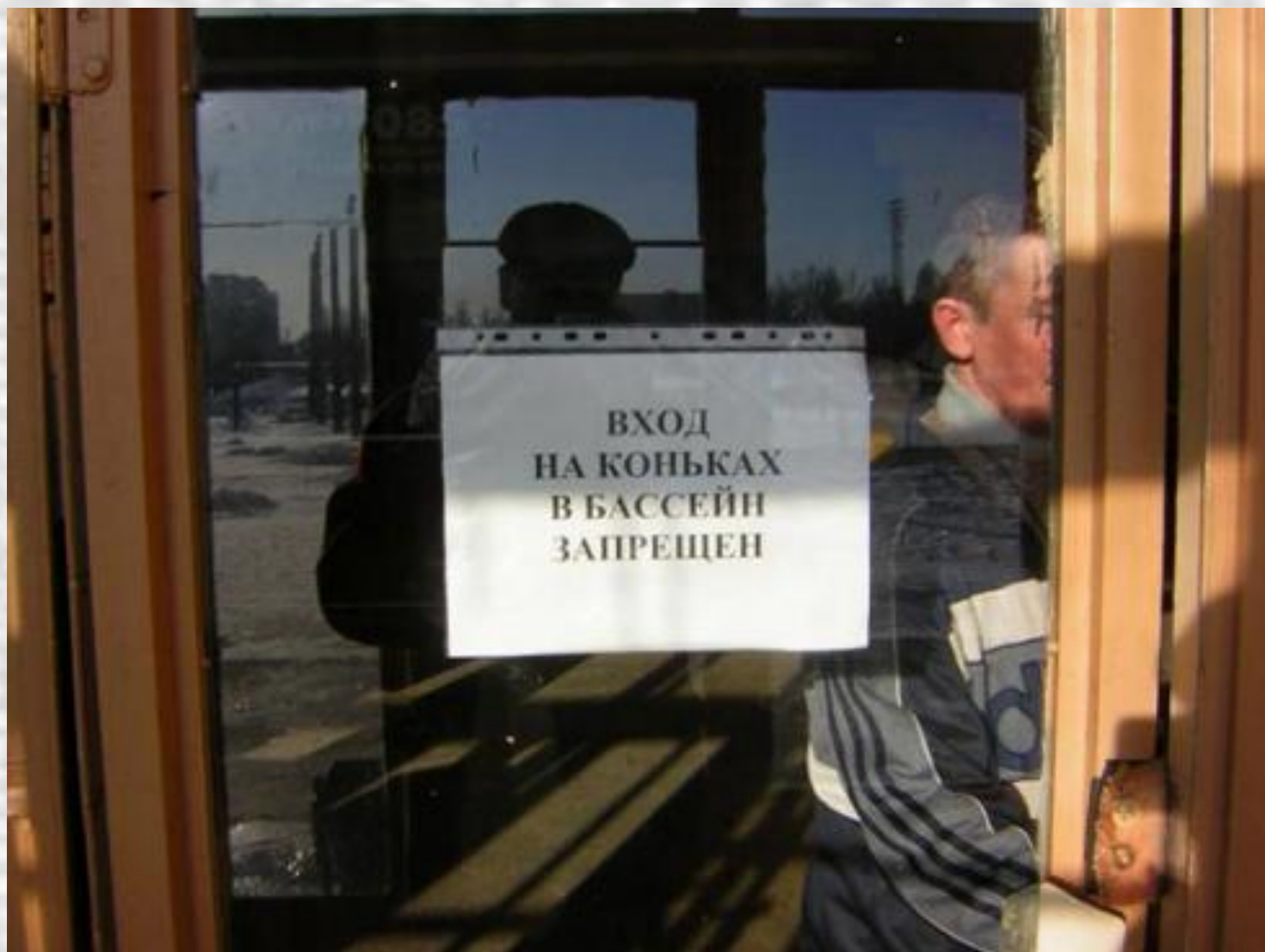
A medencébe korcsolyával belépni tilos!