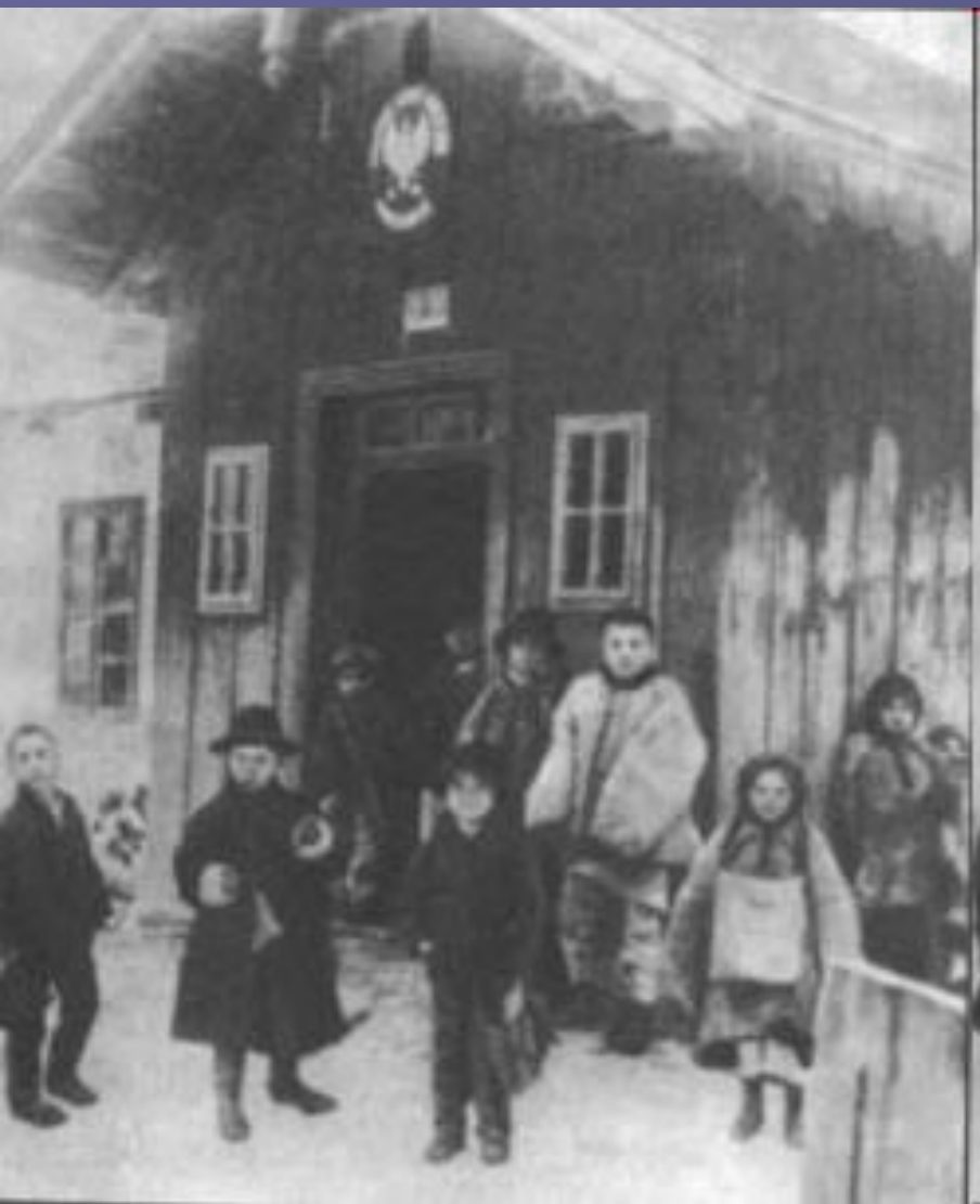
Трьохлітня школа в селі Русові, де навчався Василь Стефаник.

У 1880 році Семен Стефаник віддав свого сина Василя до другого класу початкової школи в