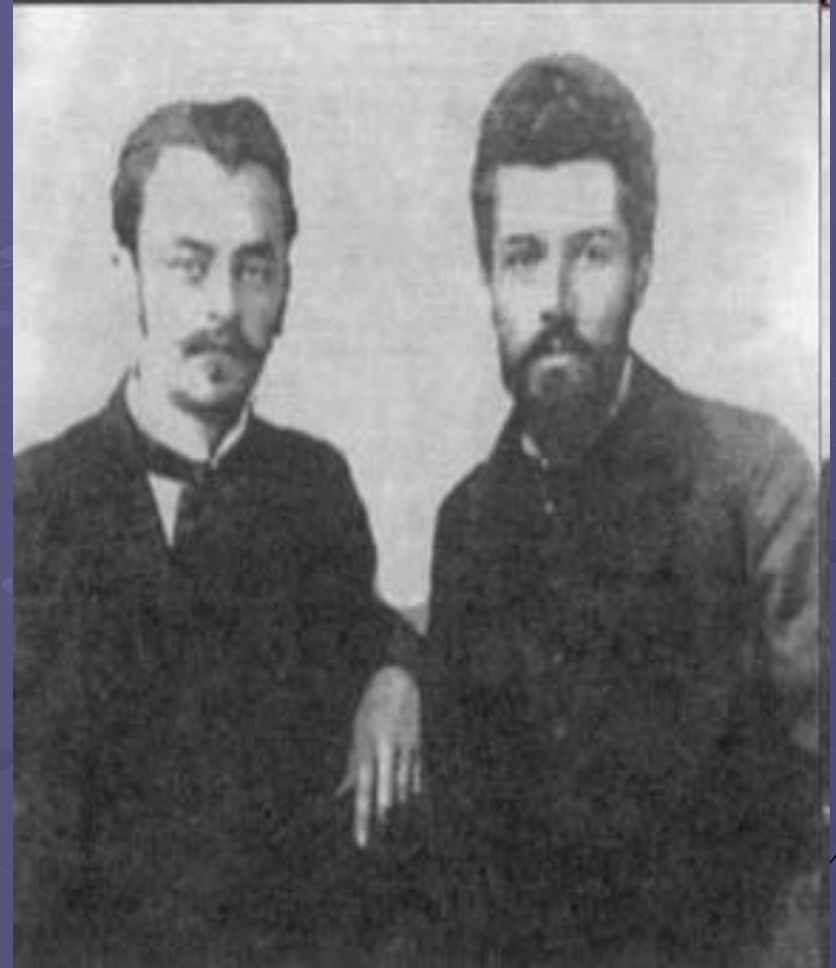
Богдан Лепкий і Василь Стефаник