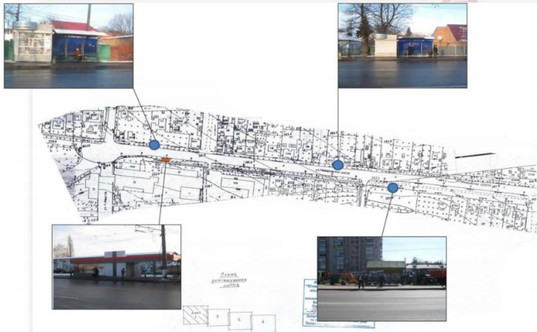
Схема розміщення МАФ по вул. Немирівське шосе (кількість – 5 шт.)