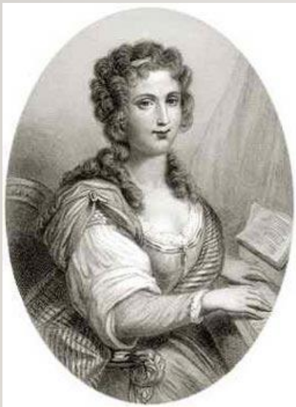
МАРИЯ ТЕРЕЗА ЛЕВАССЁР