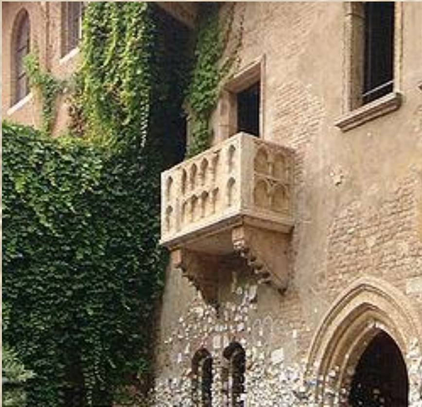
Так называемый «дом Джульетты» с балконом в Вероне

В Вероне у туристов популярны дома Джульетты и Ромео, а также гробница героини, которые исторически не имеют ничего общего с героями пьесы.