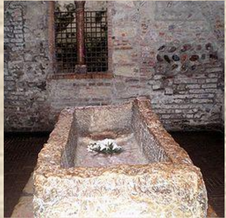
Так называемая «гробница Джульетты» в Вероне

В Вероне у туристов популярны дома Джульетты и Ромео, а также гробница героини, которые исторически не имеют ничего общего с героями пьесы.