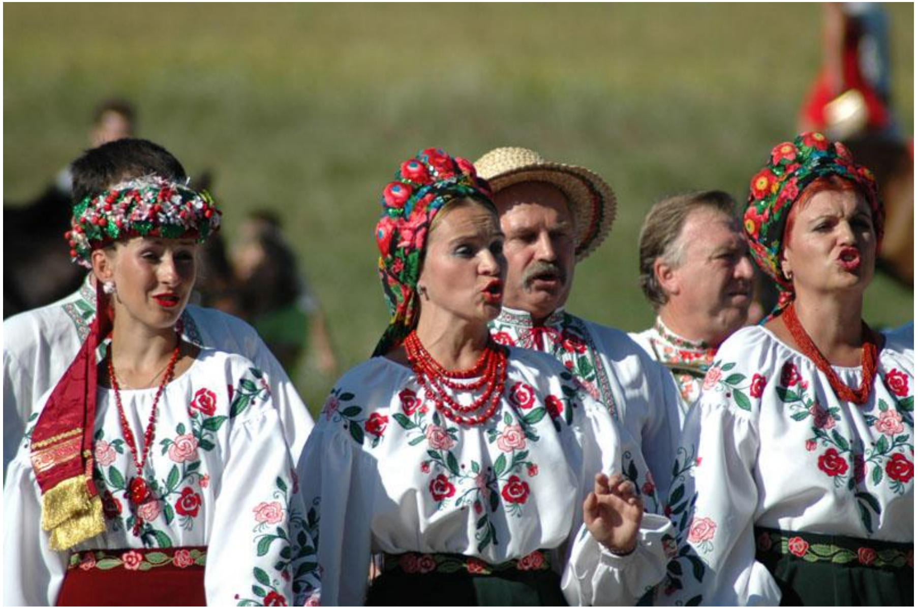
жінки в національних українських костюмах