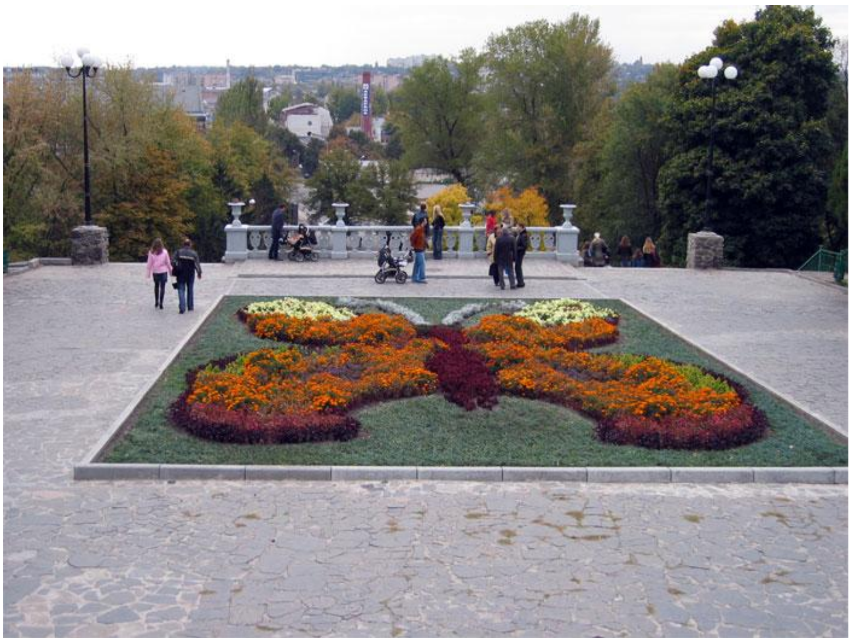
клумба-метелик у Харкові