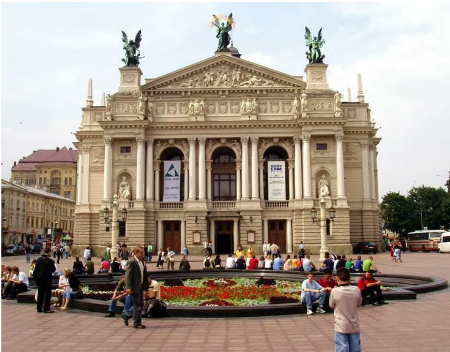
оперний театр у Львові