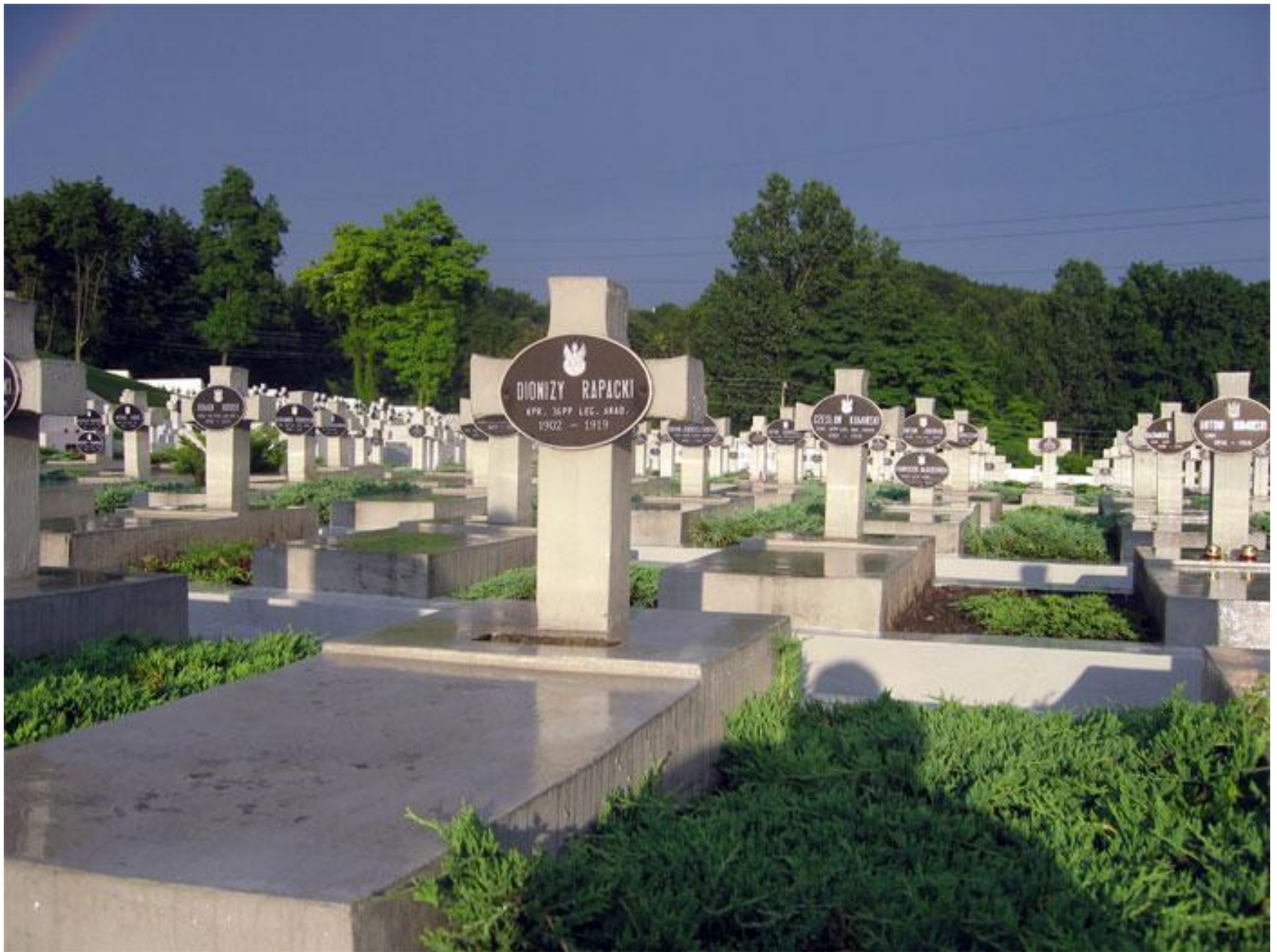
цвинтар-меморіал у Львові