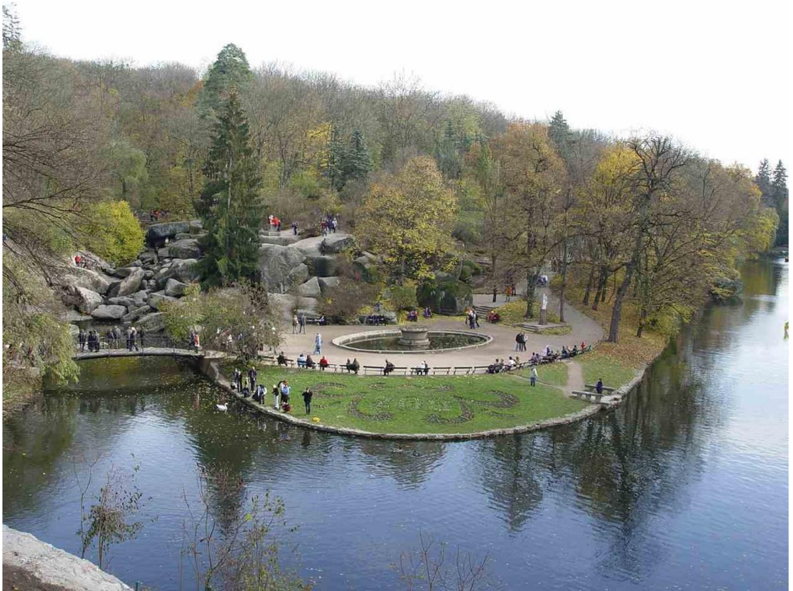
Софіївський парк, Умань