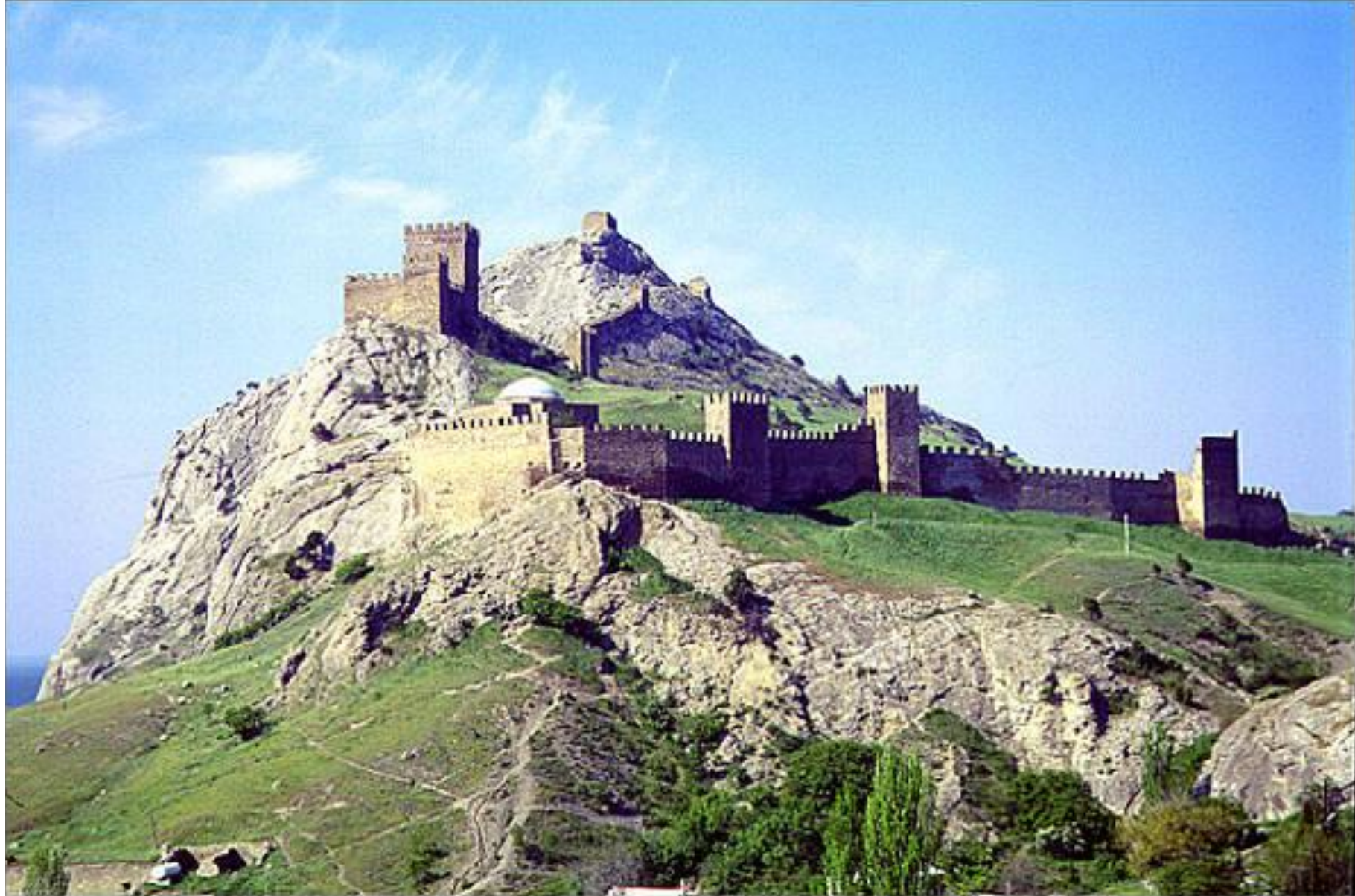
Генуезька фортеця, Судак, Крим