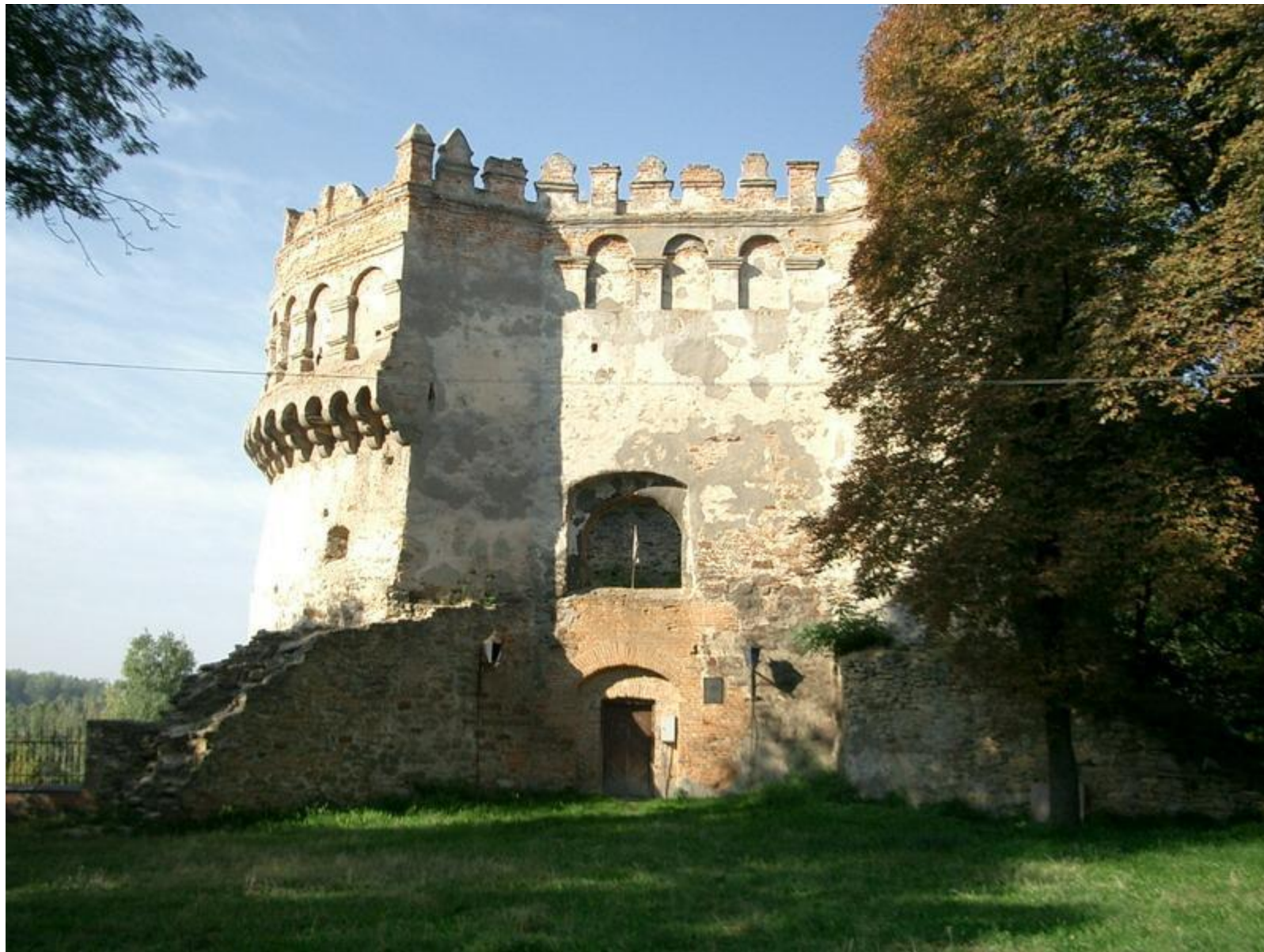
Острозька фортеця, Рівненщина