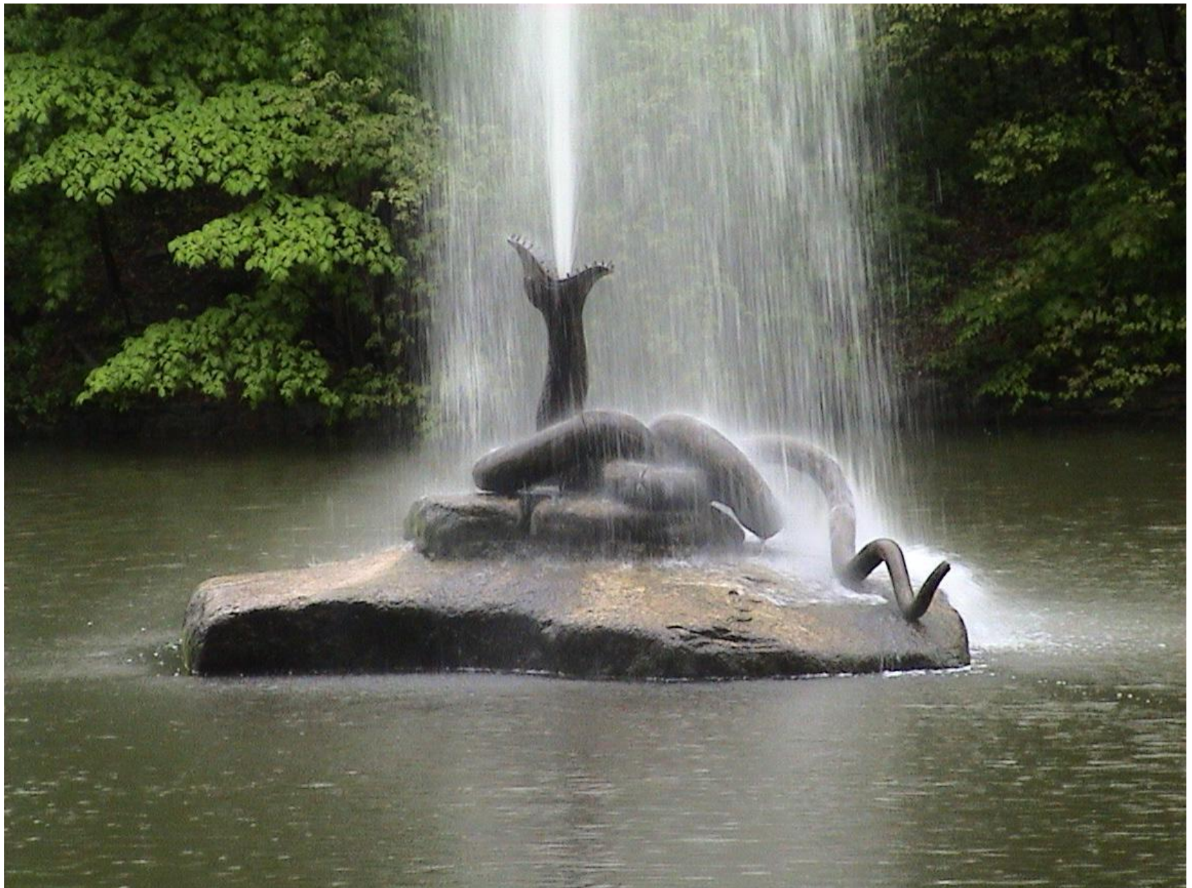
фонтан-змія в Софіївському парку