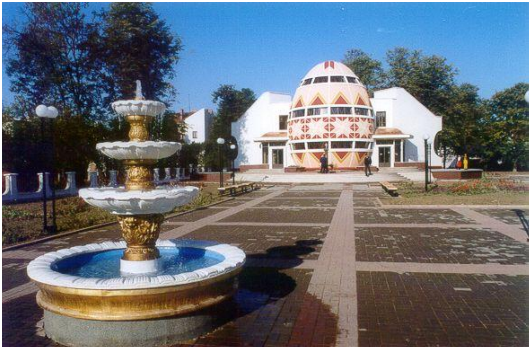
м. Коломия, готель Писанка