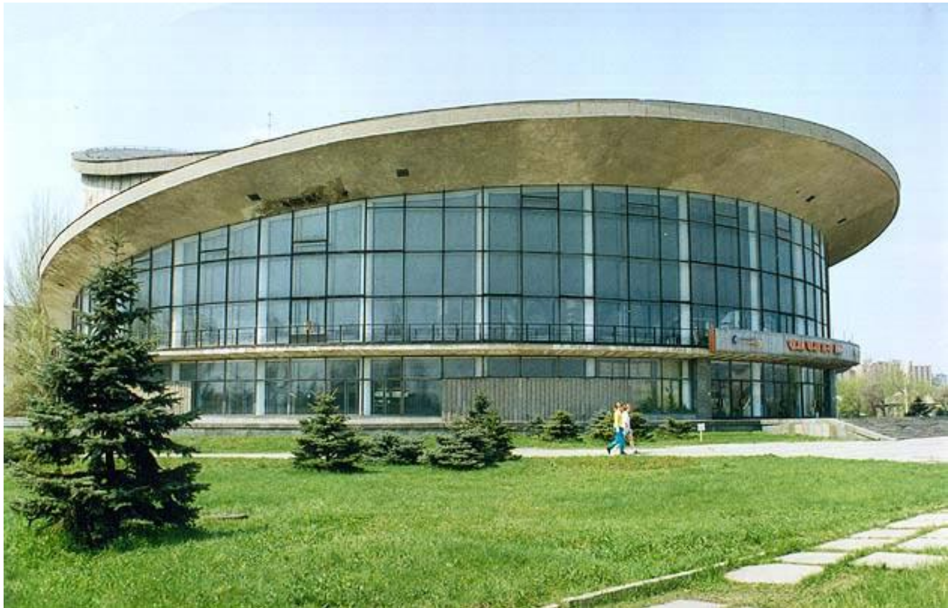
цирк у Луганську