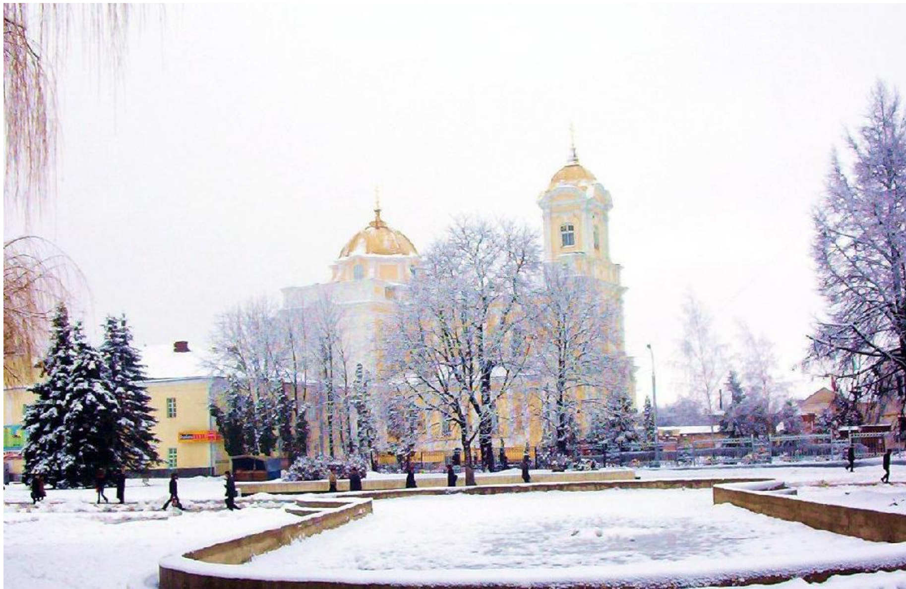
м. Луцьк, зима