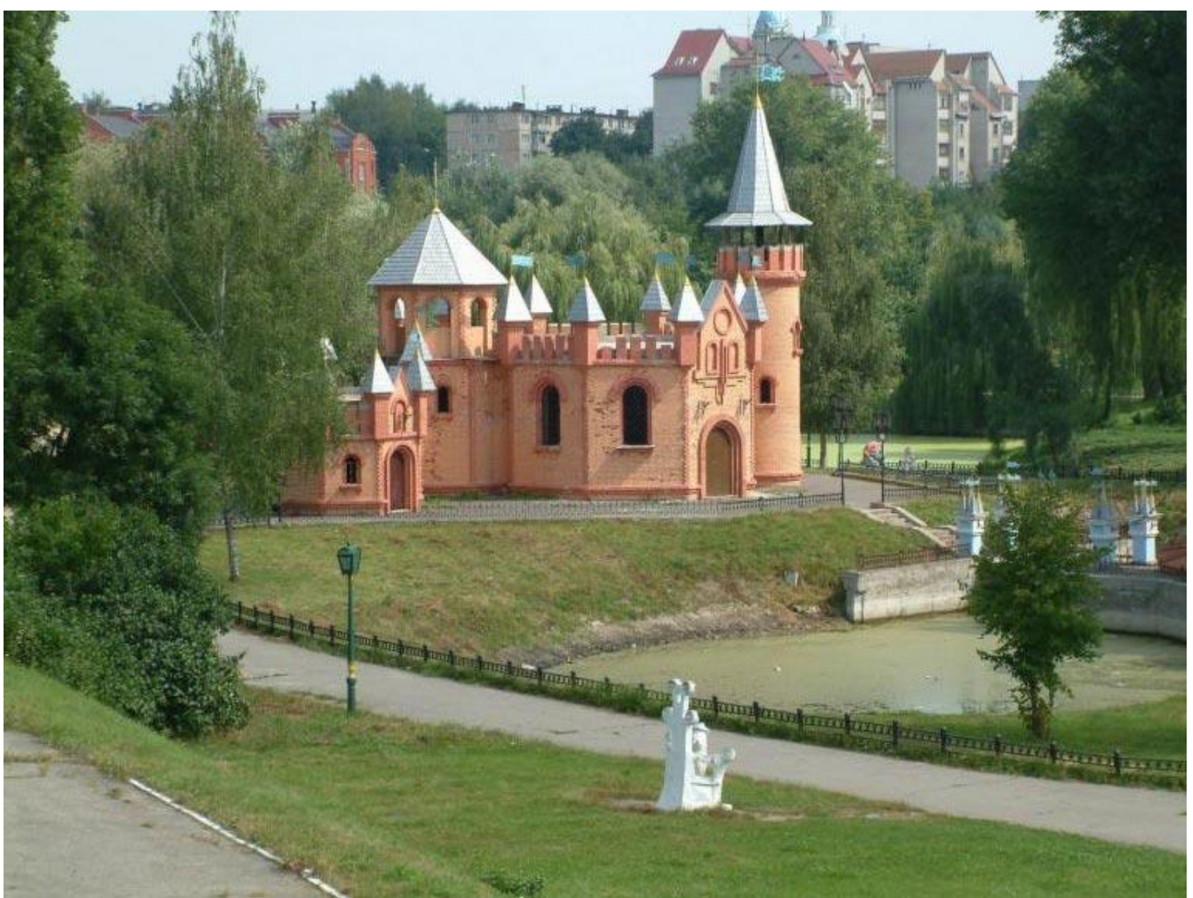
Дитячий парк і замок у м. Суми