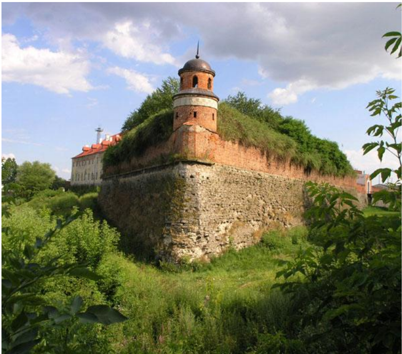
Бастіон у Дубно, Рівненщина