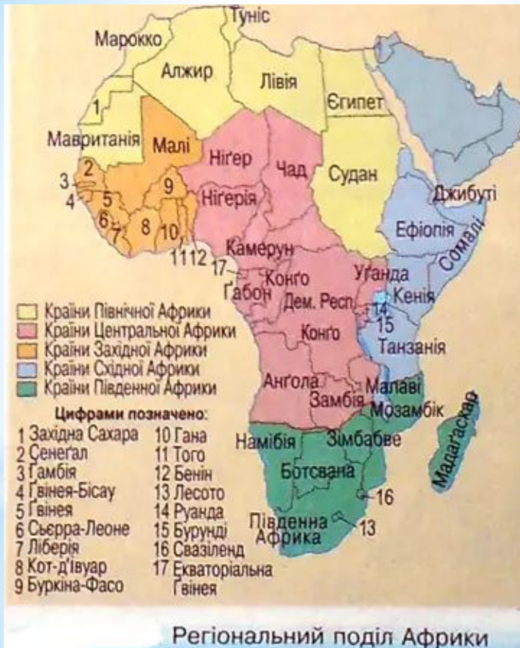
Регіональний поділ Африки