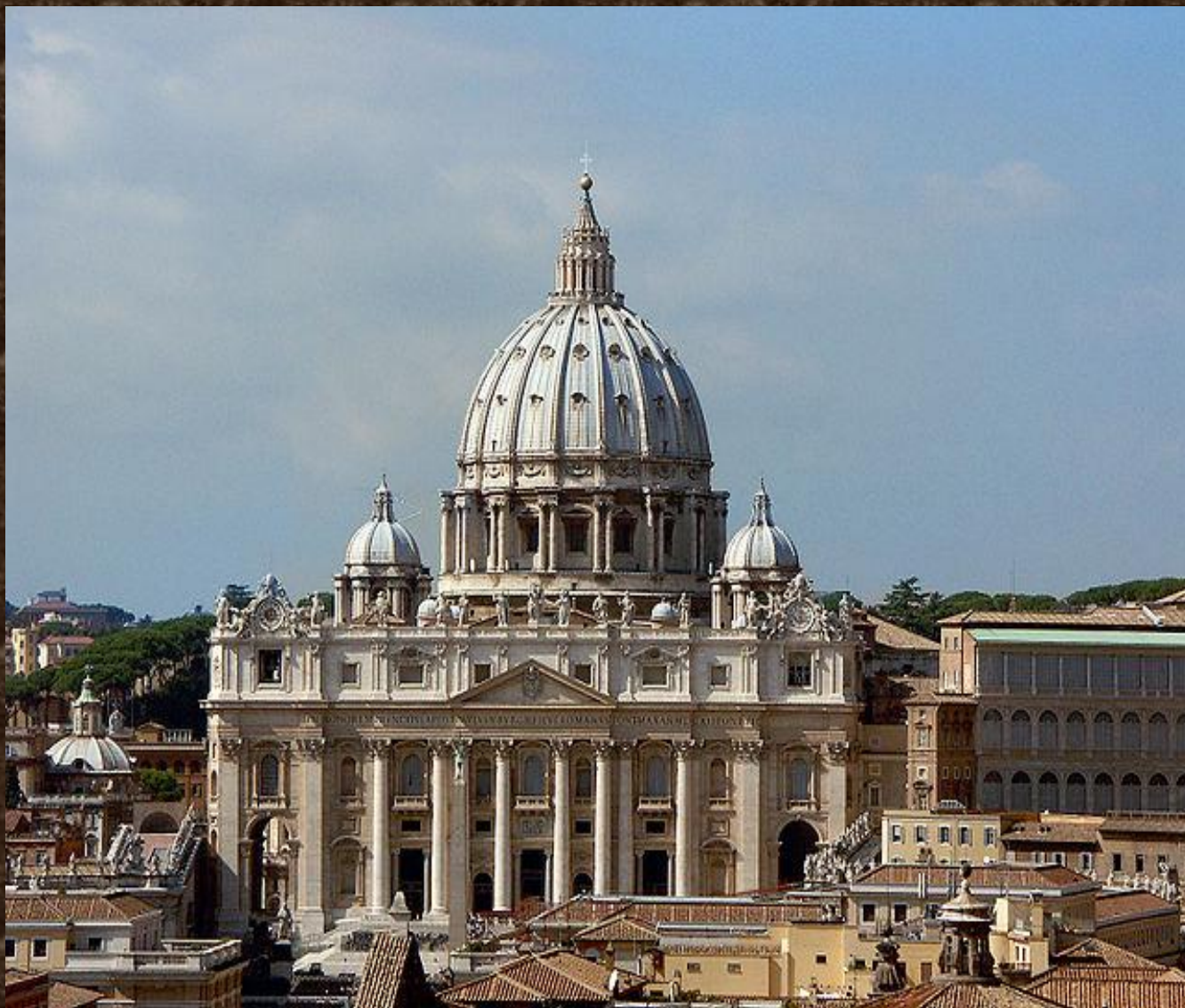
Вид на собор Святого Петра