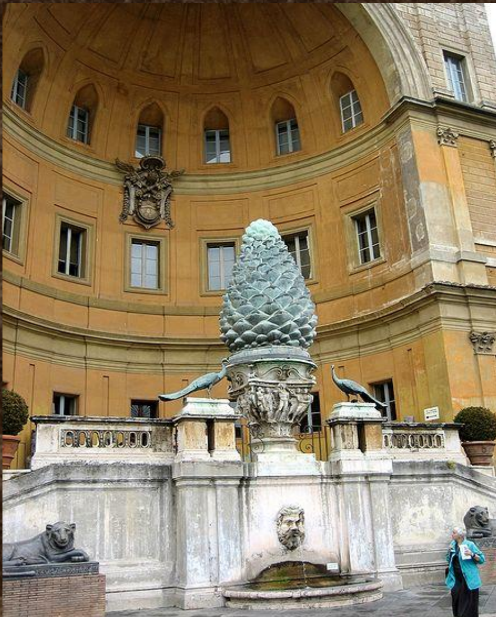
Ниша Бельведера и бронзовый римский фонтан в форме шишки.