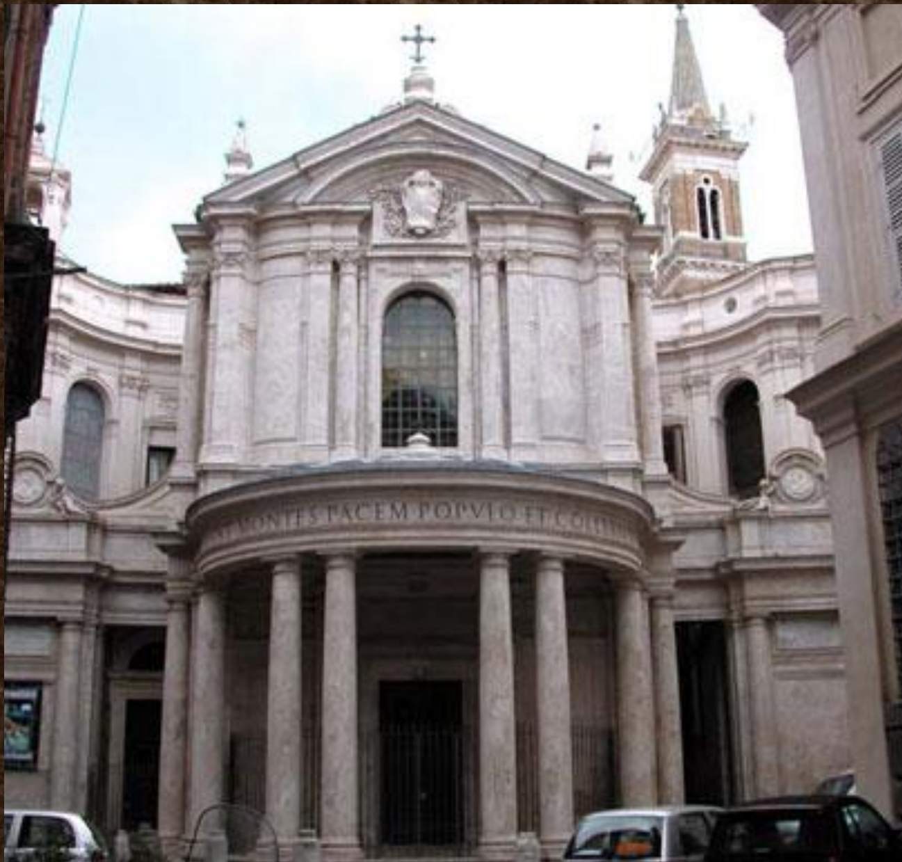
Фасад церкви Санта-Мария-делла-Паче