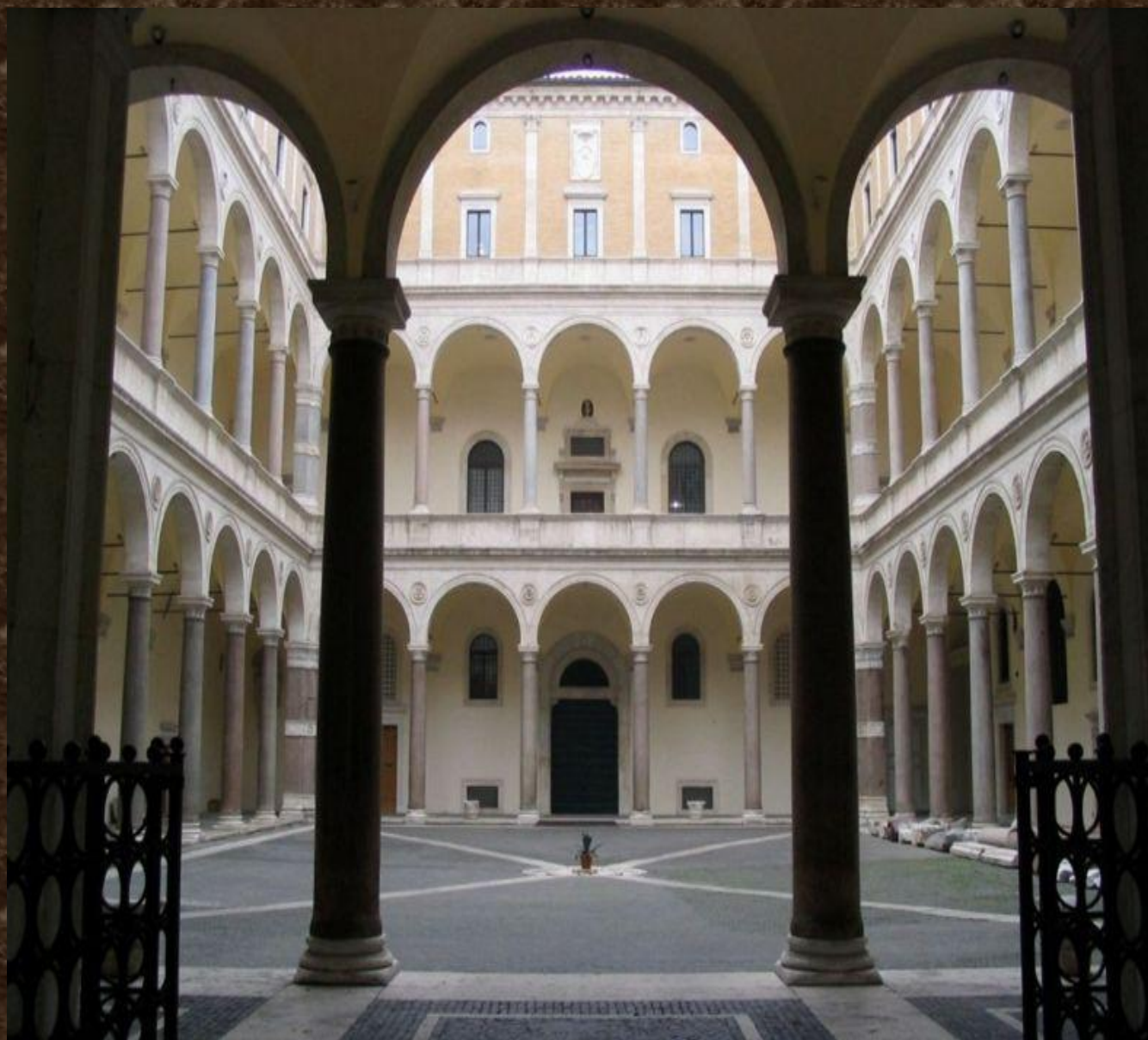
Палаццо делла Канчеллерия