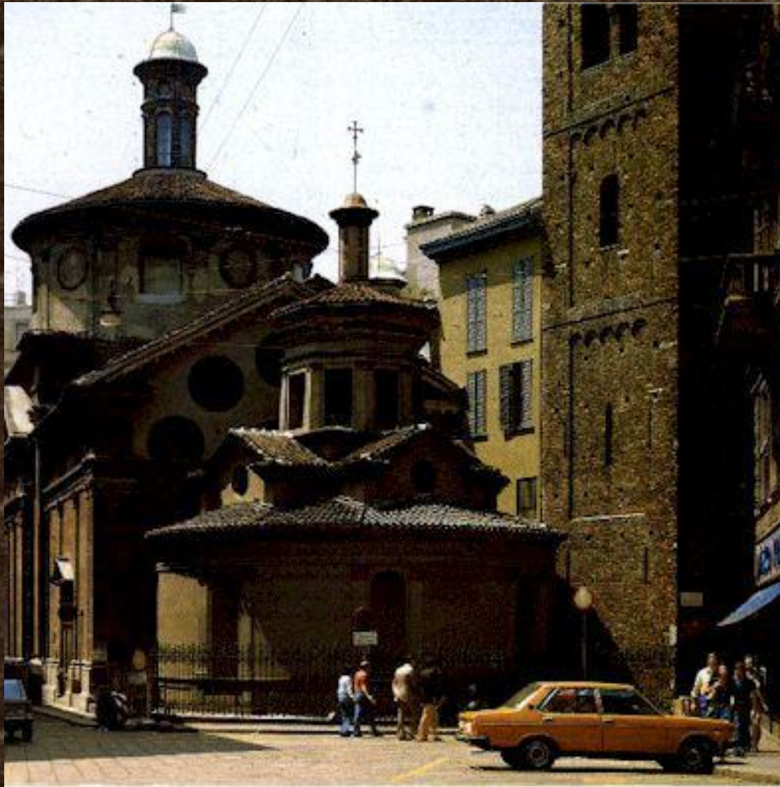
Санта Мария presso Сан-Сати́ро