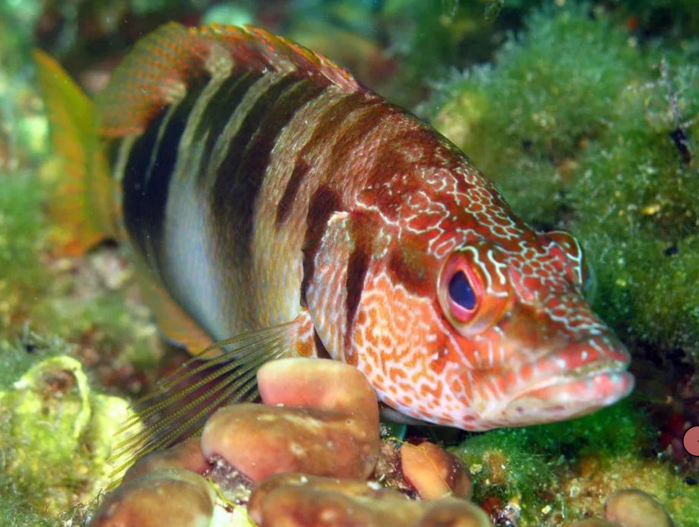
Морской каменный окунь