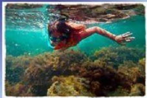
Любитель подводного плавания