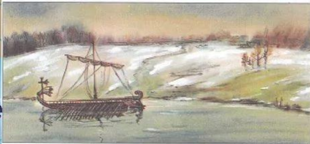
Греческий корабль у берегов Меотиды

По берегам Азовского моря – тогда оно называлось Меотидой, селились греки и строили свои города. Одним из таких городов был Танаис, который был основан в III в. до н.э.