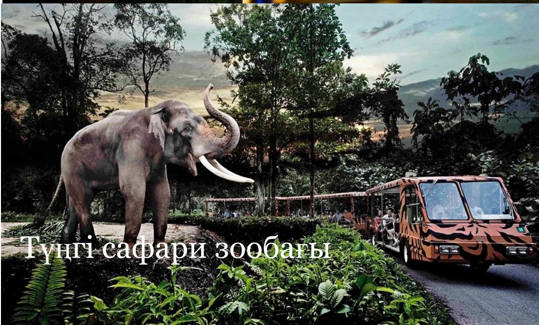
Түнгі сафари зообағы