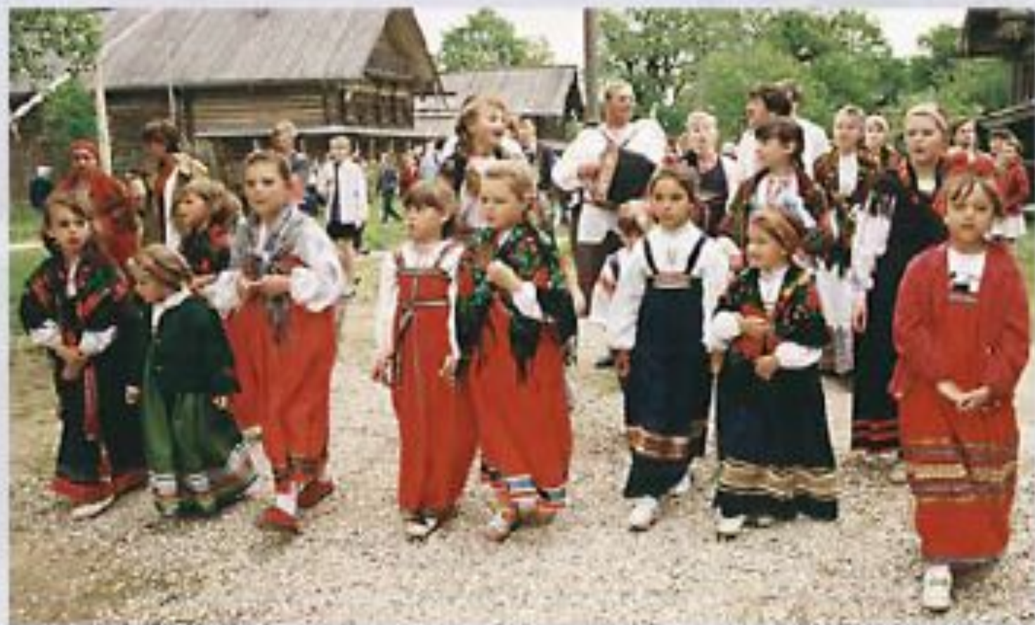
Русский национальный костюм.

Центрально-Чернозёмный район по этническому составу населения является наиболее однородным в России - доля русских превышает 90% во всех регионах, но значительна также численность украинцев. Вероисповедание обоих родственных народов - православие.