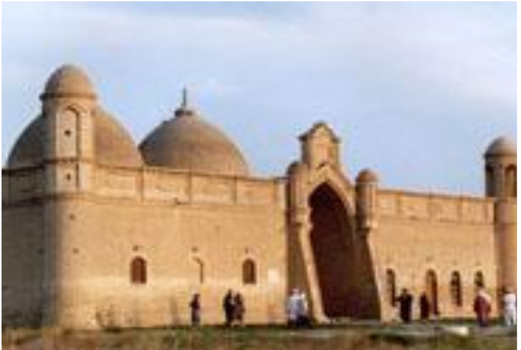
Отырар қаласындағы тарихи, құнды кесене Арыстан Баб кесенесі