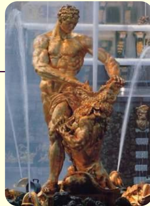
Самсон и лев (Б. Растрелли)