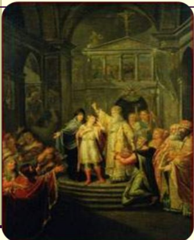
Венчание Михаила Федоровича на царство (Григорий Г.И.)