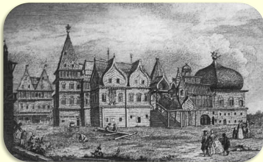
Изображение дворца на гравюре XVIII века