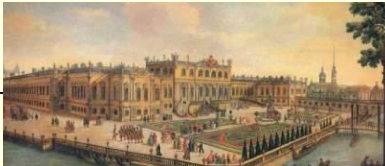
Летний дворец Елизаветы Петровны (Бартоломео Растрелли)