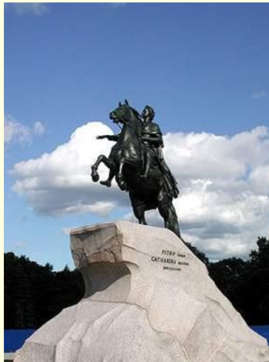
Медный Всадник (Этьен Фальконе)