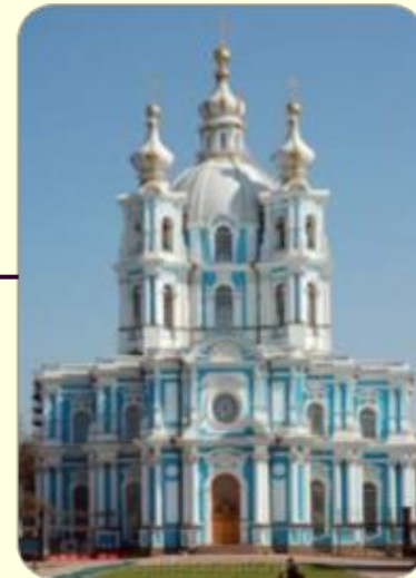
Собор Смольного монастыря