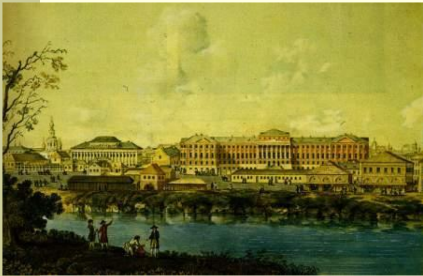
Московский Университет в XVIII