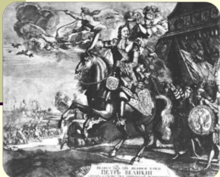
А.Ф.Зубов. Петр I на коне

Самым доступным и распространённым видом изобразительного искусства в Петровскую эпоху была гравюра. Гравюры отражали важнейшие события, служили своеобразными учебными пособиями и иллюстрациями в книгах. Самым знаменитым русским гравёром начала XVIII столетия был Алексей Фёдорович Зубов