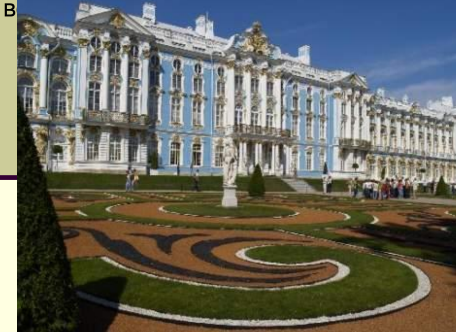
В Большой Екатерининский дворец (Бартоломео Растрелли)