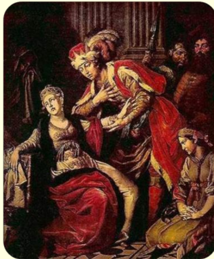
Владимир и Рогнеда (А. П. Лосенко)