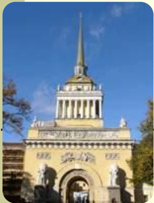
Адмиралтейство (И. К. Коробов)