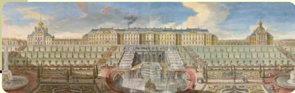
Большой Петергофский дворец(И. Браунштейн, Б.Ф. Растрелли)