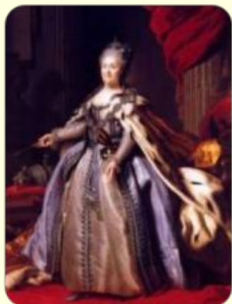
Художник Ф. Рокотов