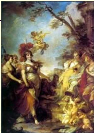
Екатерина II и Екатерина Дашкова