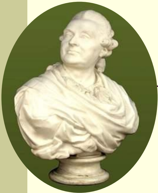
Бюст А.М. Голицына (Ф.И. Шубин)