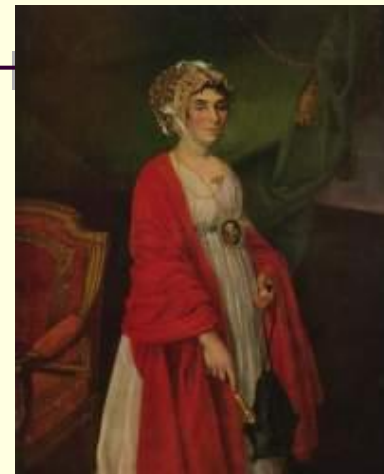
Прасковья Жемчугова (Н.И. Аргунов)