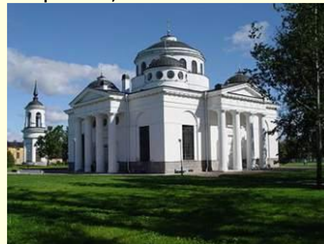
Софийский собор (И.В. Старов)