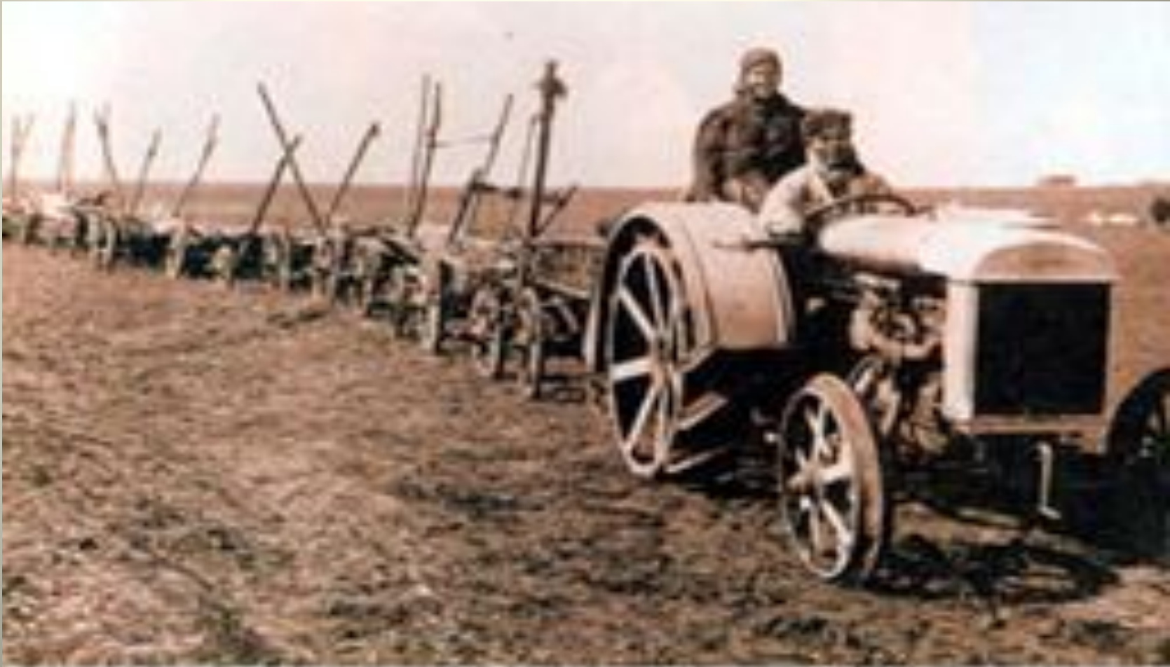
Новая техника в колхозе. 1929 г.

У січні 1928 р. винесено рішення про примусове вилучення у селянства зернових надлишків і необхідність форсованої колективізації сільського господарства. Група членів ЦК ВКП (б) під проводом М.Бухаріна виступила проти відновлення воєнно-комуністичних методів економічної політики, але зазнала поразки. Перемогли прихильники точки зору Сталіна, які наполягали на необхідності проведення суцільної колективізації, тобто суцільного насадження системи колгоспів.