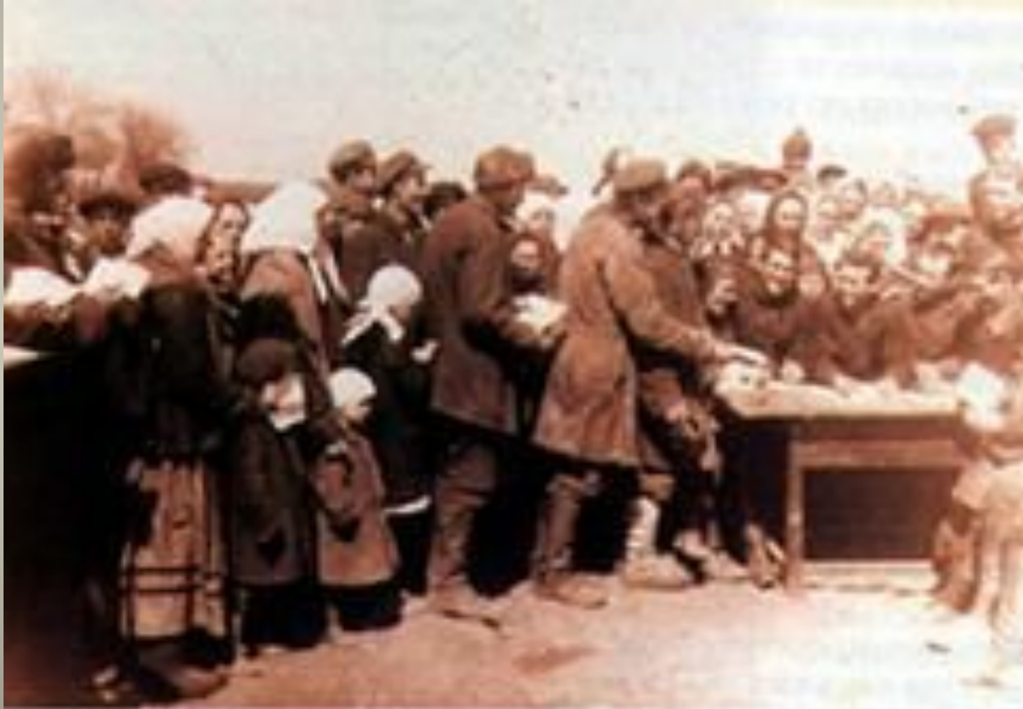
Крестьяне села Чегорошки подают заявления о вступлении в колхоз. 1930 г.

Передбачалося перетворити всіх трудівників села на державних робітників, а земельну власність — на державну.