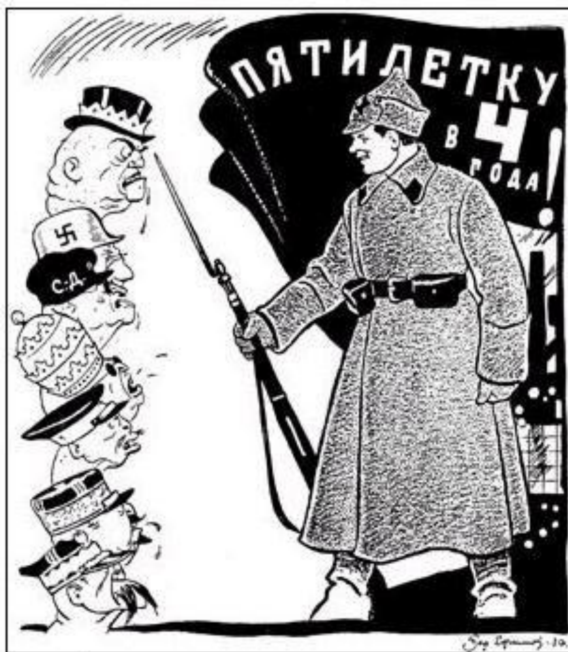
Семь бед – один ответ! Борис Ефимов. Из альбома «Карикатура на службе обороны СССР», 1932 год