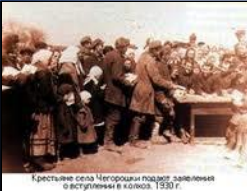
Крестьяне села Чегорошки подаю заявленія о вступлении в колхоз, 1930 г.

Уроки індустріалізації було запроваджено величезну кількість машин, агрегатів, механізмів, що викликало необхідність істотного підвищення освіти і перш за все технічної грамотності кадрів, масового оволодіння новою технікою, різноманітними професіями, технологічними процесами. Усе це також мало прогресивне значення. Разом з тим держава використала це для того, щоб переглянути норми виробітку в бік їх збільшення на 35–45%. Учасниками сталінської програми соціалістичної індустріалізації стали й мільйони репресованих „ворогів народу