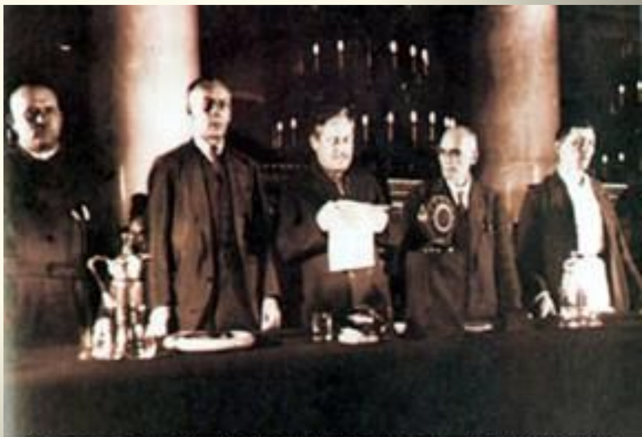
Председатель Верховного суда А. Вышинский оглашает приговор по "шахтинскому делу"

Наприкінці 20 — у першій половині 30-х рр. репресії було спрямовано здебільшого проти "класово ворожих" верств суспільства: „буржуазних спеціалістів”, „непманів”, „куркулів”. Найбільш гучними процесами того періоду були "Шахтинська справа" (1928 р.), процес "Трудової селянської партії" (1929 р.), "Промпартії" (1930 р.), процеси над антипартійними групами.