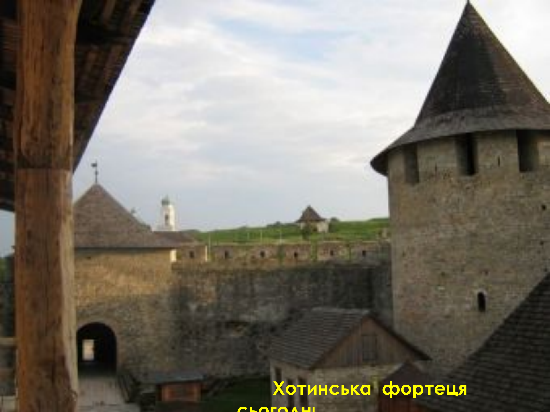
Хотинська фортеця СЬОГОДНІ