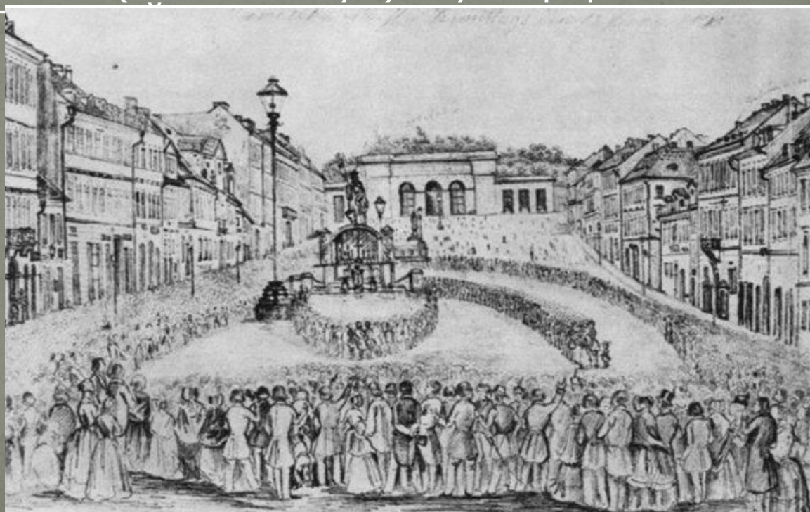
Конгрес у Празі 1848