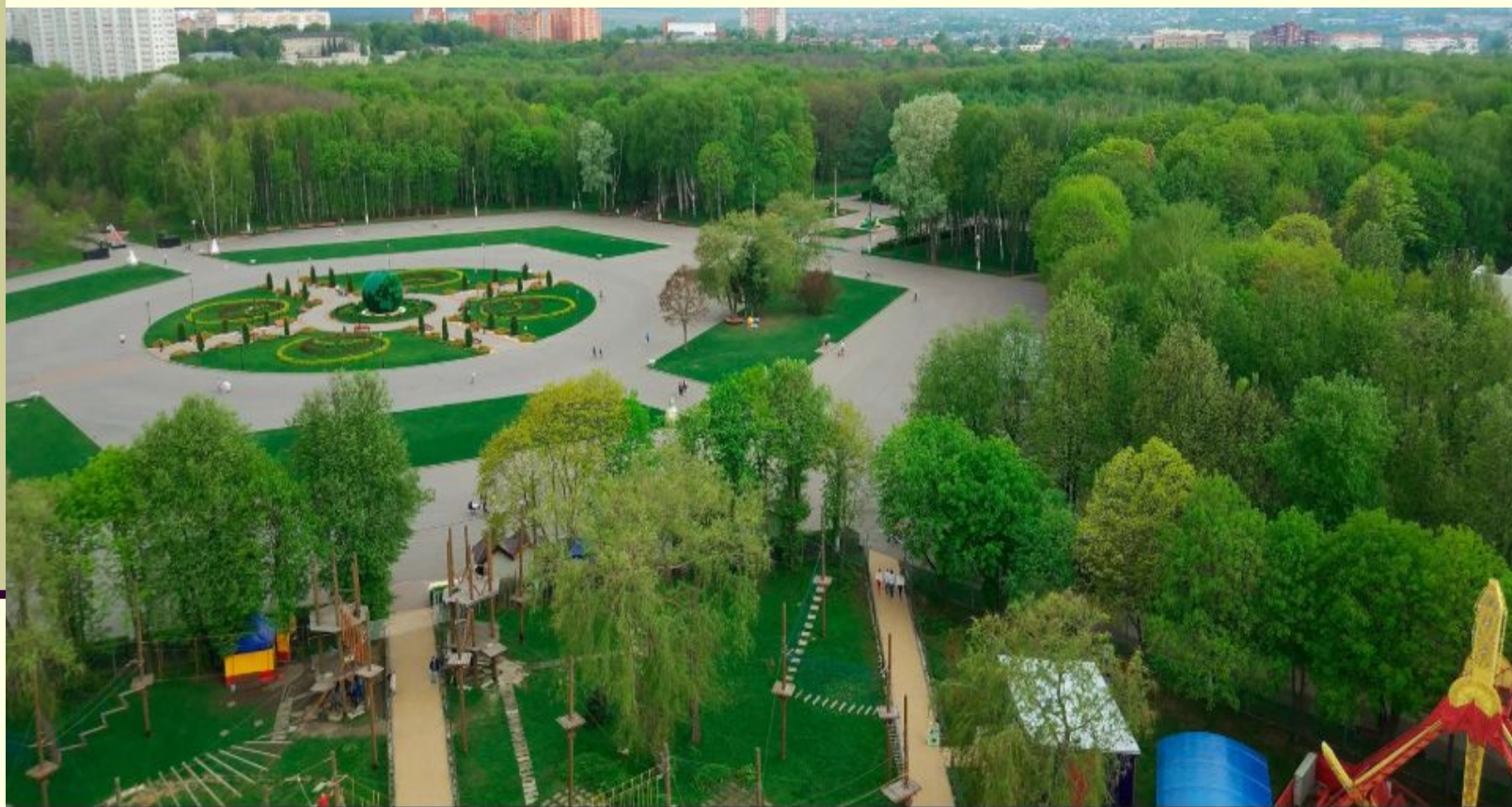
Центральный парк им. П.П.Белоусова

По итогам проводившегося в 2014 году Всероссийского конкурса на звание «Самого благоустроенного городского (сельского) поселения России» Тула заняла III место в категории «Городские поселения (городские округа), являющиеся административными центрами (столицами) субъектов Российской Федерации».