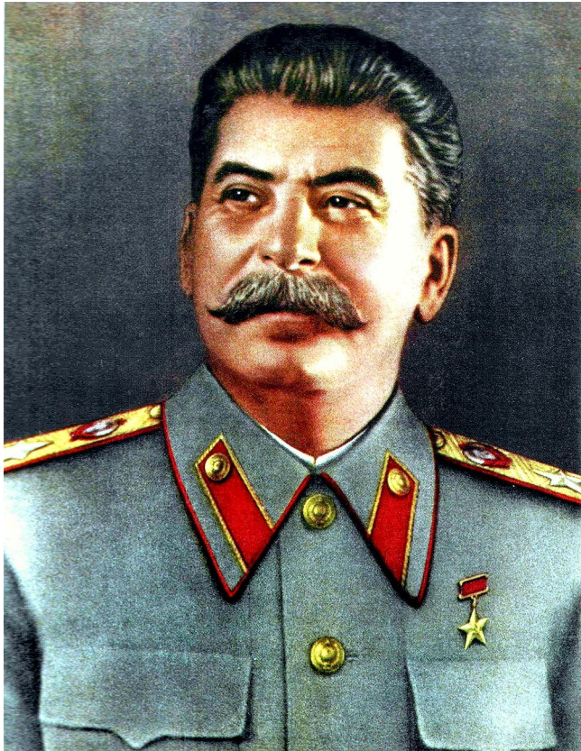
И.В. СТАЛИН – секретарь ЦК ВКП(б), Председатель СНК (Совета министров).