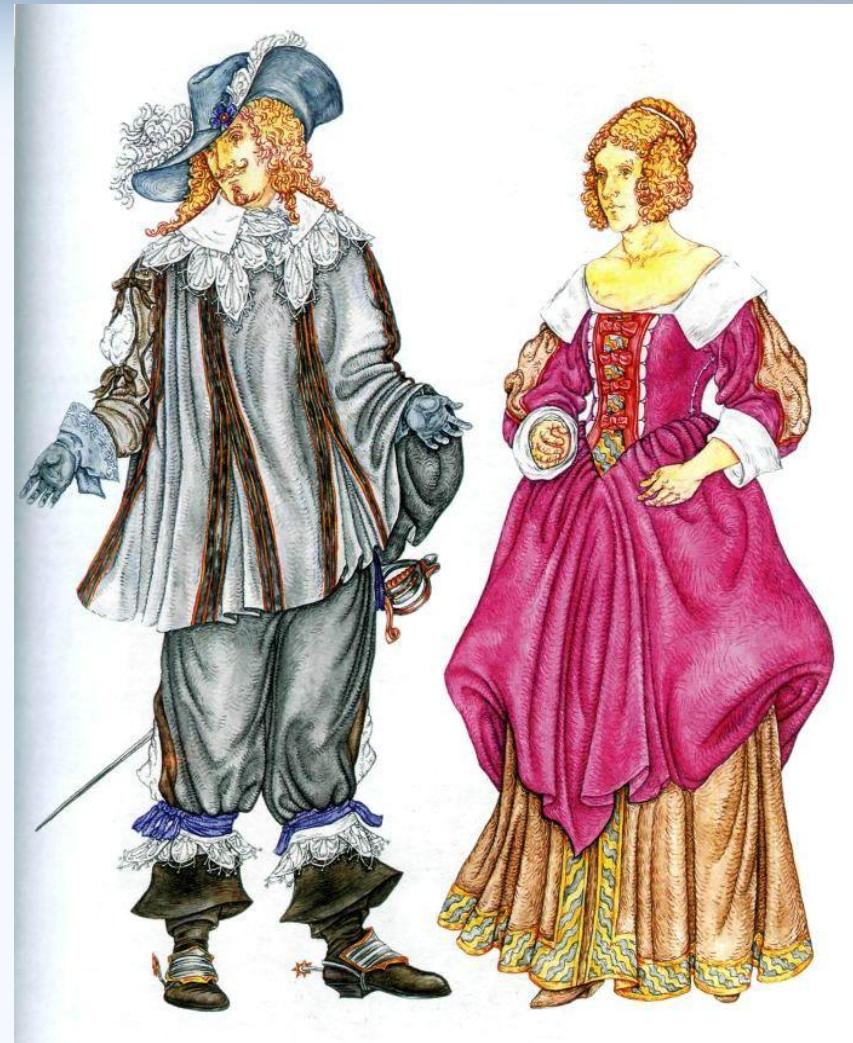
Мушкетер киімі ,шляпа а-ля-Рубенс, ботфорт-аяқ киімі және қала тұрғыны киімі.