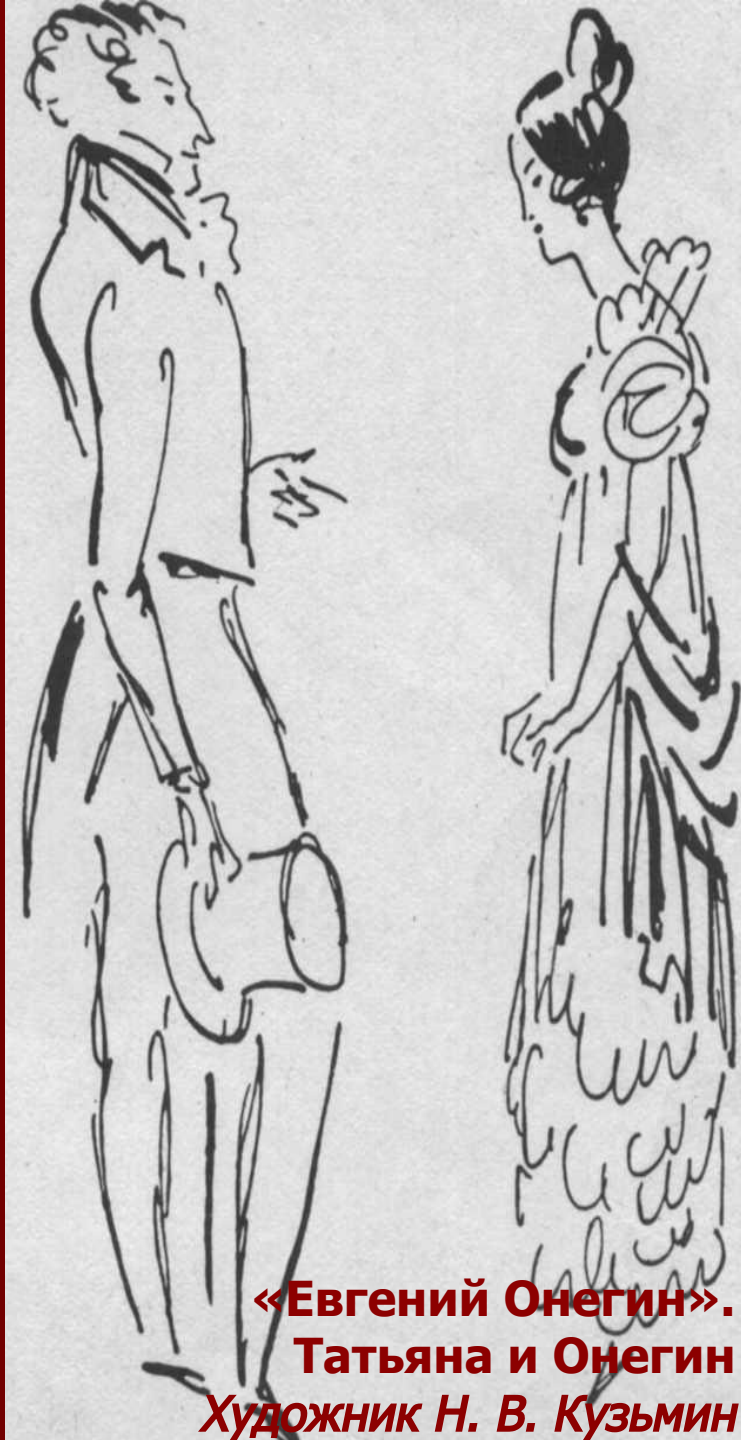
«Евгений Онегин». Татьяна и Онегин Художник Н. В. Кузьмин

Испытание дружбой и любовью показало: внешнее отрицание общепринятых предрассудков и мнений не означает внутреннего освобождения от них.