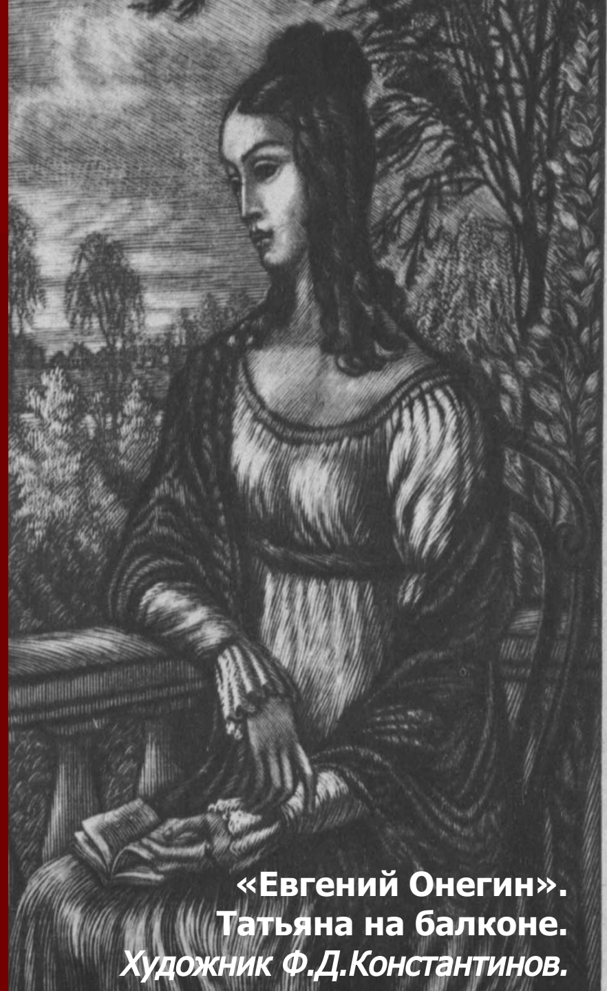
«Евгений Онегин». Татьяна на балконе. Художник Ф.Д.Константинов.