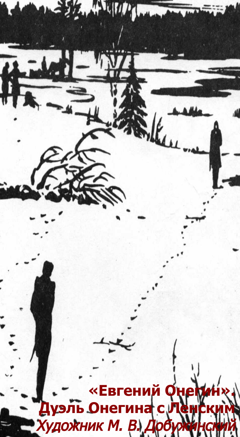
«Евгений Онегин». Дуэль Онегина с Ленским Художник М. В. Добужинский