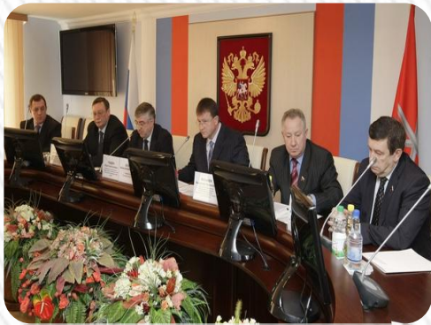
Засідання урядів Франції та Росії

У Франції встановлена основним законом організація виконавчої влади і існуюча практика зумовили перетворення президента на реального главу уряду.