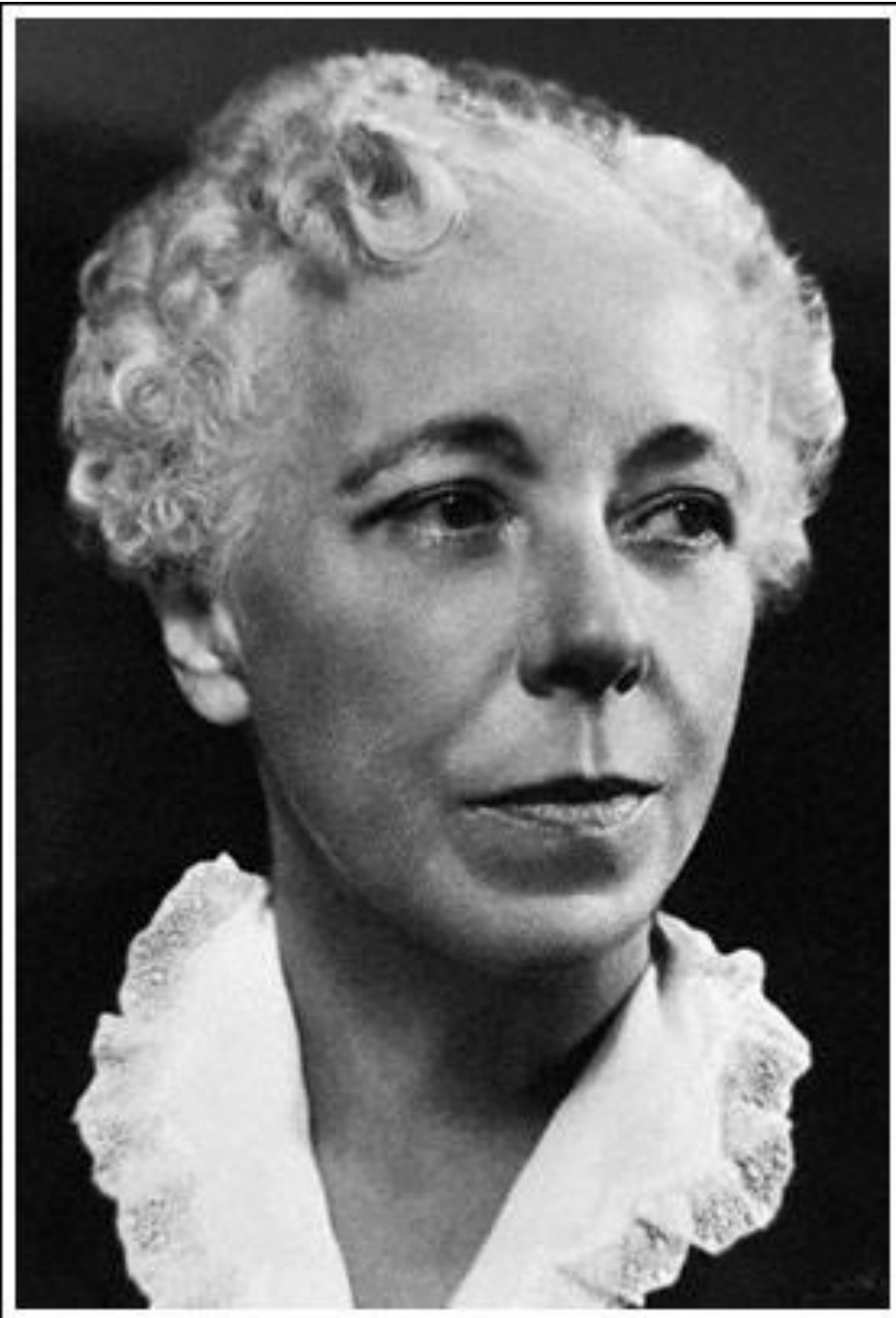
К. Хорни (1885-1952)