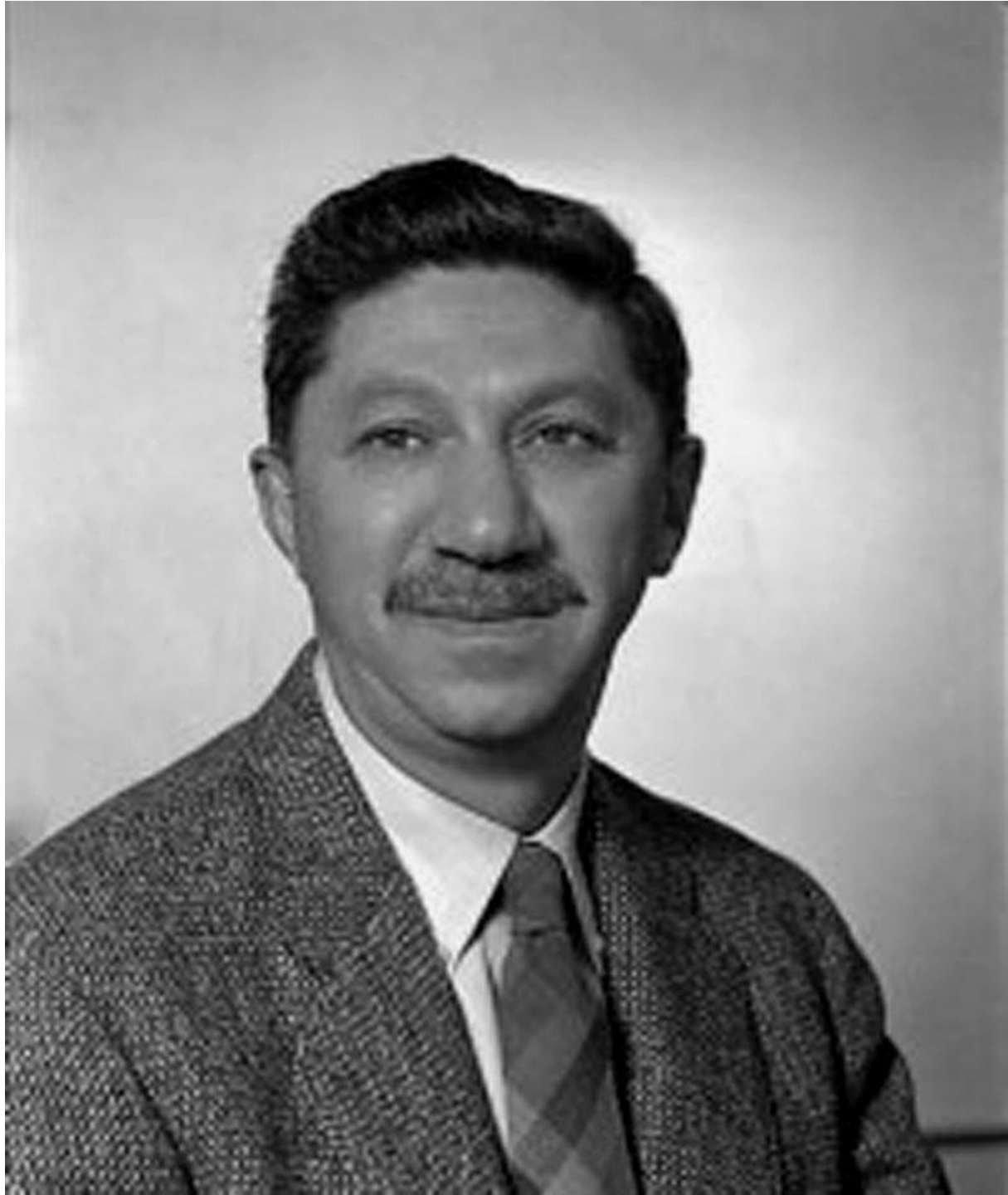
A. Маслоу (1908-1970)