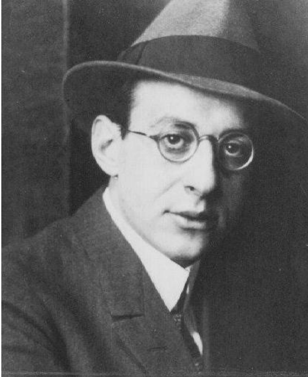
Ф. Перлз (1893 - 1970)