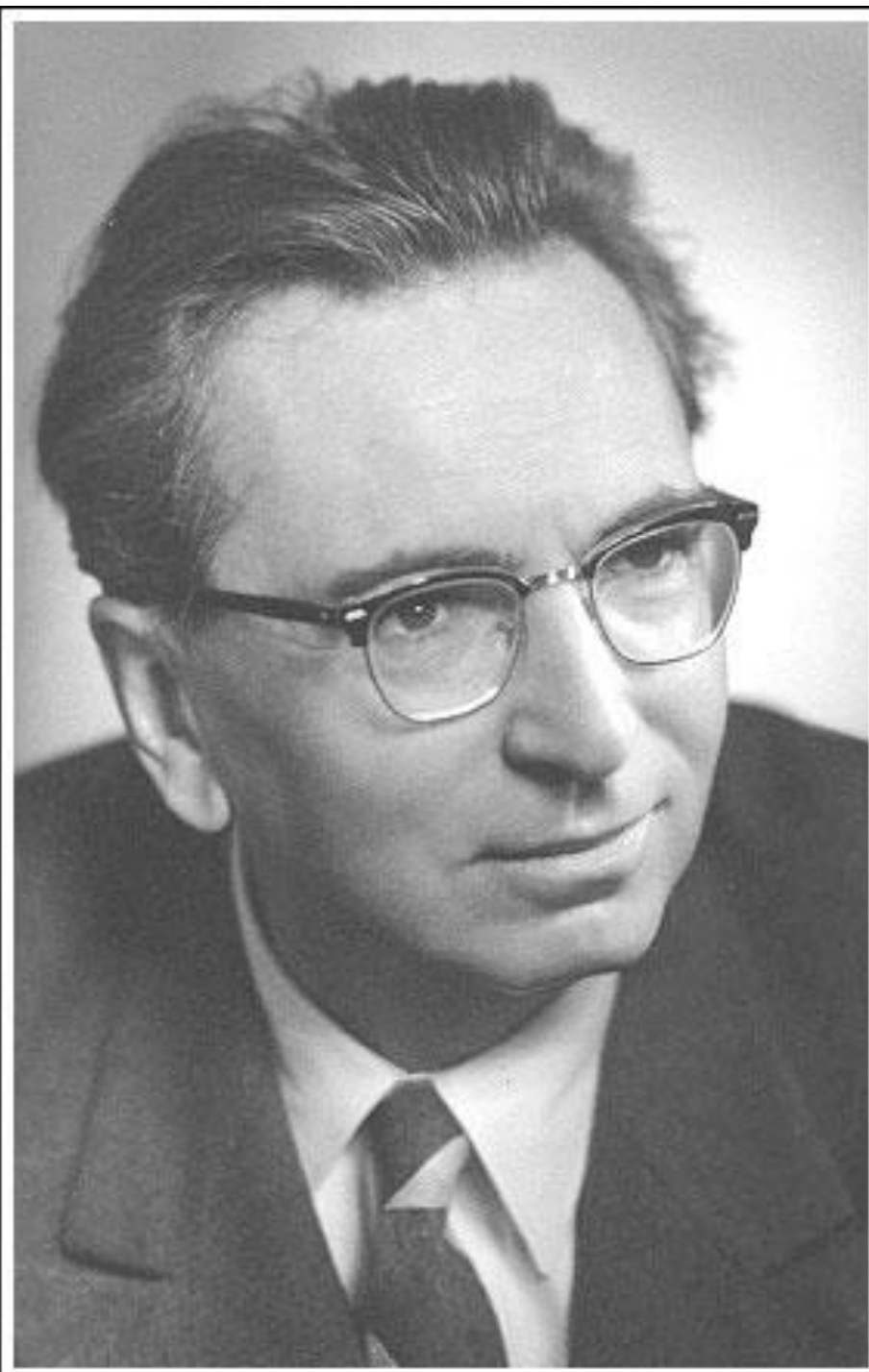
В. Франкл (1905 - 1997)